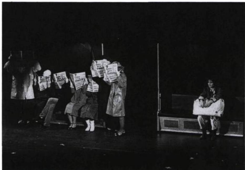
« Linie 1 contient beaucoup d'espoir, de vie, malgré les énormes problèmes sociaux que la pièce met en jeu.» Deux scènes du spectacle présenté au Theatertreffen à Berlin, en 1987, par le Grips Theater.