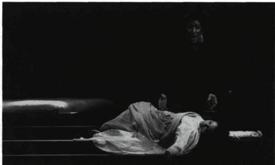
Otello de Verdi, dirigé par Antoine Vitez à l'Opéra de Montréal. «Il est intéressant de rapprocher toute tragédie de son origine, de remonter à sa source, au fait divers sordide.»

Un tel témoignage donne conscience au jeune acteur que ce que l'on joue n'est pas arbitraire. Naturellement, sous forme d'exercice, on peut s'amuser, à l'intérieur de l'école, à jouer l'interprétation la plus tragique, puis une interprétation comique, puis à voir