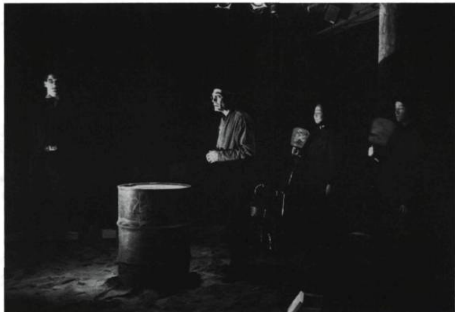
Le baril de métal, rempli de monnaie, servira «d'axe symbolique pour la partie de poker».