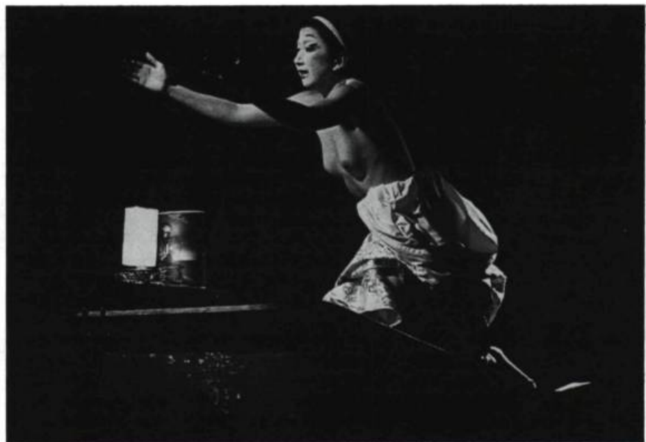
Tirer parti d'images toutes faites : la geisha, emprisonnée dans sa représentation d'elle-même.

Déracinée violemment, transplantée dans un milieu où rien ne peut lui rappeler son histoire, devenue subitement et artificiellement une madame Wong à qui elle ne s'adapte pas (elle a du mal à signer son « nom de femme » sur les formulaires d'admission de Stella à l'hôpital), Jeanne vit, en effet, la quintessence du drame.