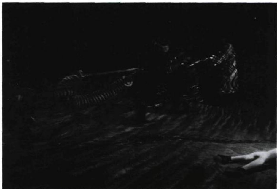
L'accouplement symbolique du yin et du yang : le tao de la Trilogie .

le tout : les trois langues, les trois époques, etc.), une œuvre d'une perfection formelle absolue qui est celle, du reste, de toute œuvre bien construite — holographique ou non —, une œuvre comblante où l'intelligence circule avec la sensibilité, où de simples grains de sable font scintiller mille lueurs dans les yeux et dans la tête des spectateurs. Comme Youkali agenouillée parmi les étoiles dans la scène la plus apaisante, la plus large, la plus pleine de la Trilogie , je me suis sentie bien dans cet univers, remplie d'un nouveau souffle et d'une nouvelle chaleur. Alors, comme le dirait plus simplement le Chinois de légende qui habite désormais une petite cabane embrumée installée à demeure dans un coin de ma mémoire : «Méci».