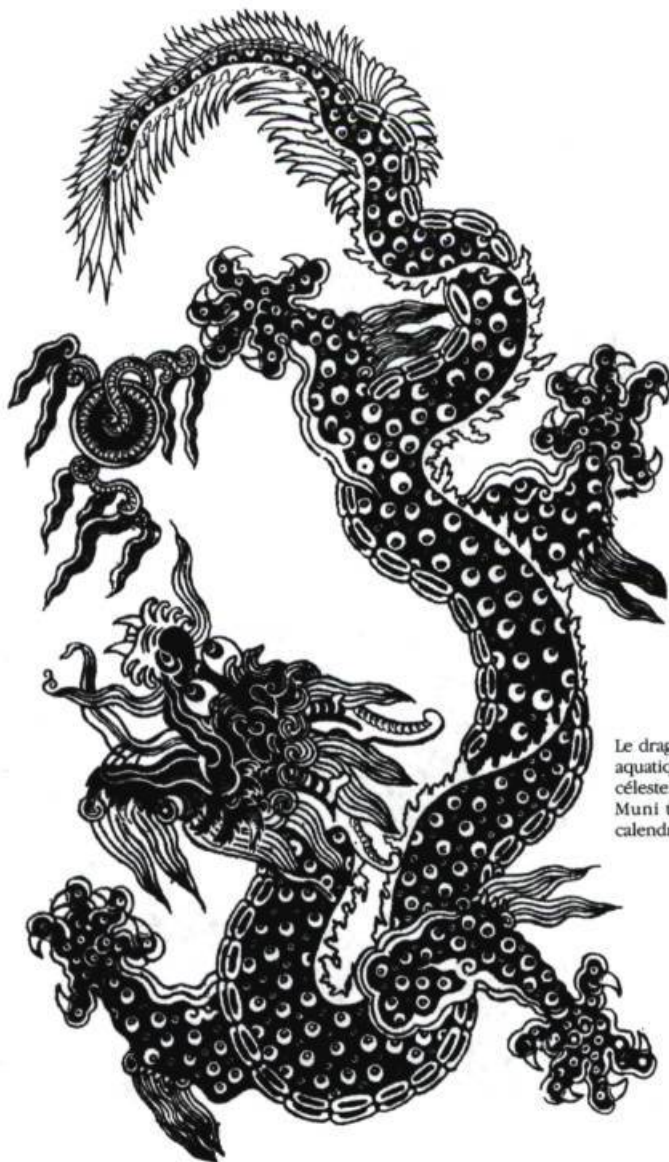
Le dragon, à la fois aquatique, terrestre et céleste. Illustration de T. Muni tirée d'un calendrier tibétain.

Crawford «s'éteint» en retournant littéralement aux origines : à son lieu de naissance mais aussi à l'eau, à la mer d'où il est venu. Sa fréquentation des éléments est celle du spectacle entier, lequel explore l'eau, le feu, la terre et l'air comme matériaux organiques constituant l'étoffe même des impressions qu'il élabore. Ce désir de puiser dans le sol, de s'enraciner, qui a donné lieu à la Trilogie , explique du reste que ce spectacle obsédé par la mort soit en même temps traversé par des images de renaissance et de croissance : la terre signale la vie aussi bien que son terme — tout comme le dragon, ce «gardien» de l'immortalité, a une signification à la fois démoniaque et céleste; il est aussi bien aquatique, souterrain, que terrestre et aérien, crachant le feu, amenant la pluie et réunissant, de ce fait, la foudre et la fertilité, la mort et la vie. Le symbolisme des dragons, on l'a vu, correspond à celui des