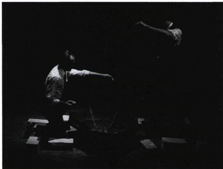
À l'aide de pièces de monnaie et d'un parapluie ouvert qui les recueille, Lee explique à Crawford sa conception de la vie.