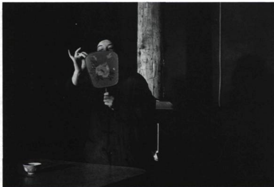
Certains personnages, telles les deux sœurs chinoises absorbées dans la finesse de leurs dessins sur des éventails, sont «eux-mêmes des abstractions».

l'autre personnage — Morin — qu'elles s'étaient relancé d'une boîte à souliers à l'autre était joué par le même comédien que le client avec lequel elles «jouent» à présent... Quant à Jeanne, la voici vendeuse de chaussures, comme jadis au moment où Crawford, mû par leur inspiration, avait fini par «se ramasser» chez le Chinois.