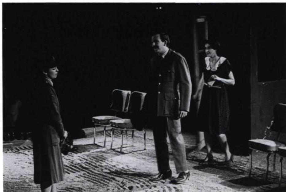
Jeanne et Françoise, à Toronto, «jouent» avec un client — francophone — incarné par le même comédien que celui qui tenait le rôle de Morin (qu'elles s'étaient jadis relancé d'une boîte de chaussures à l'autre).