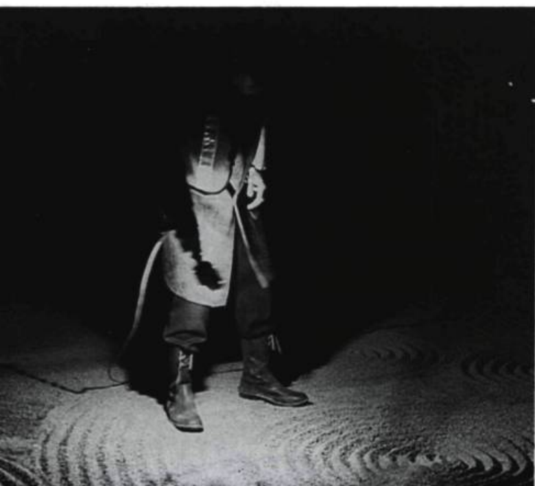
Le gardien promène sa lampe sur le sol métaphorique que creusera la Trilogie .

Le terrain de stationnement dont ils se sont inspirés marque l'emplacement réel de l'ancien quartier chinois de Québec, d'où, par des migrations inventées, émergeront, dans le spectacle, ceux de Toronto et de Vancouver. Creusant ce sol métaphorique, des reliques de l'ancien Chinatown à la découverte spirituelle de la Chine elle-même, ils ont déterré les trois dragons constituant leur trilogie et en ont épousé la symbolique : le dragon vert, aquatique et correspondant traditionnellement au printemps, est ici associé aux caves humides de Québec, à l'enfance et au début de l'aventure; le dragon rouge, terrestre et correspondant au feu et à l'été, est ici associé au train, à la guerre et à la maturité; le dragon blanc, aérien et correspondant à l'automne, marque ici l'indépendance, le déclin qui prépare la fin du cycle et son commencement, le retour au point de départ : l'aéroport de Vancouver, l'art, l'ascension vers la spiritualité, et l'avion s'engloutissant, pour finir, dans la mer, dans l'eau première. Toute la Trilogie se déroulera en rapport avec ces trois moments de l'évolution et avec la révolution (au sens de rotation) qu'ils accomplissent. Ces étapes sont également celles qui marquent, dans la pensée occidentale, le chemin vers la connaissance : la sensation (la perception, la préhension pure), la dramatisation