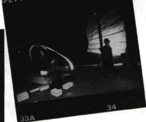
Le rêve du Chinois. Hissant la voile qui l'emportera «au pays du souvenir», il en fait émerger ses deux sœurs.