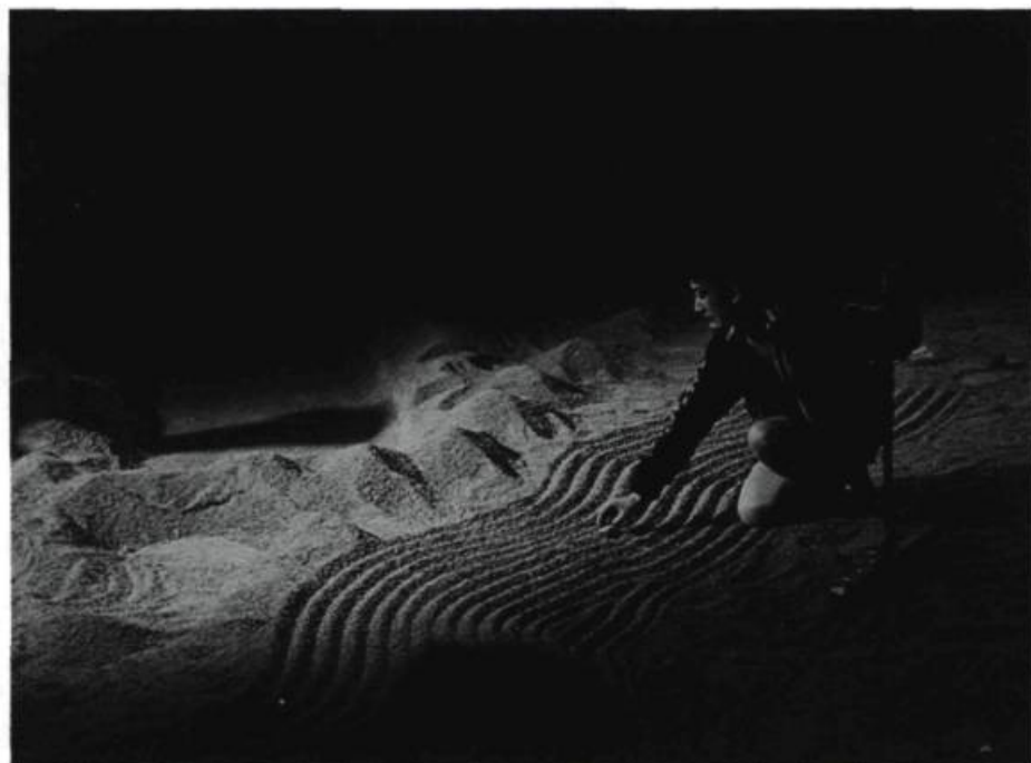
Youkali pose un petit bateau de papier sur les sillons qu'elle vient de tracer dans le sable.

Posant un petit bateau de papier (plié selon la technique de l'origami) sur des sillons de sable qu'elle vient de tracer, Youkali conte la légende du dieu Kamikaze, qui, soufflant sur l'océan, avait englouti une flotte chinoise ennemie des Japonais au XII e siècle, tandis que le pilote, un avion de papier en main, entre et relate l'histoire des commandos-suicide japonais à la fin de la Deuxième Guerre mondiale, dont «l'unique et ultime mission était de s'écraser désespérément sur leur proie dès qu'ils étaient touchés...» Il laisse tomber son avion sur le bateau de Youkali, elle froisse l'avion en le défiant du regard; il sort. Dans la musique qui augmente de volume, il revient et l'aborde, l'invite, la harcèle, cherche à la retenir, frappe à la vitre de son kiosque, y prend des objets, lui fabrique un Concorde en papier et le lui offre, se disant aux commandes. Affligé par son refus, il enflamme l'avion, lequel, selon son affabulation empreinte d'esprit de conquête, «s'abat désespérément [...] dans le milieu du Pacifique... comme un kamikaze...» Il lance l'avion en flammes sur le sol; Youkali, furieuse, va l'éteindre.