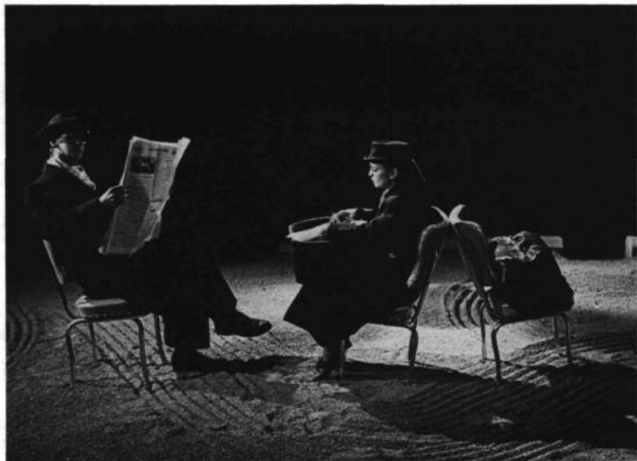
Le train : un Anglais lisant son journal, une CWAC écrivant à son fiancé.

Crawford : And if you don't find shoes to fit you, at least, you'll have a chance to find your cousin Jeanne. (Il va s'asseoir dans son compartiment.) It's a small world, isn't it.