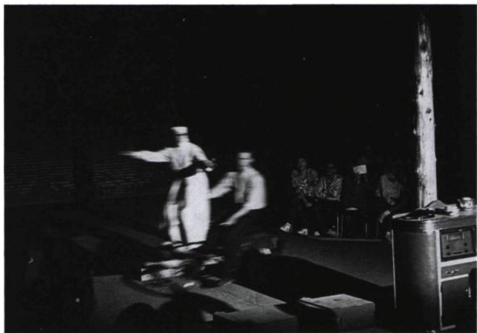
Hissée sur la bicyclette de Bédard, la sœur, exaltée, énumère les avantages de ce moyen de locomotion: «Cinq avantages... Cinq! Comme les cinq étoiles du drapeau communiste chinois!»