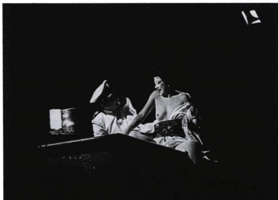
La geisha et son officier.