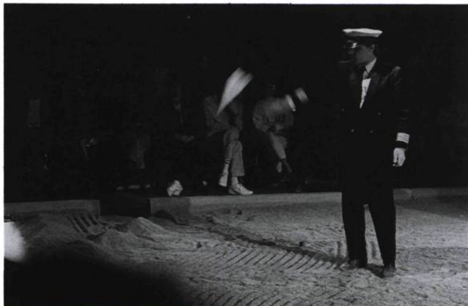
Le pilote construit un Concorde: «Je vais vous montrer: French origami.»

Youkali: What do you want? It's the third time you come here this week... And you touch me, and you take my paper, and you take my toys. This is my space, it's a small space, but it's mine, and when you are here, I can't breathe. You are taking my air.