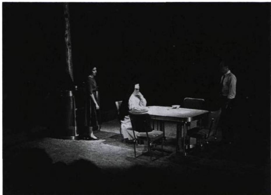
Chez Jeanne et Lee, Sœur Marie de la Grâce attend discrètement le règlement du conflit culturel qui oppose les époux quant à l'hospitalisation de Stella.