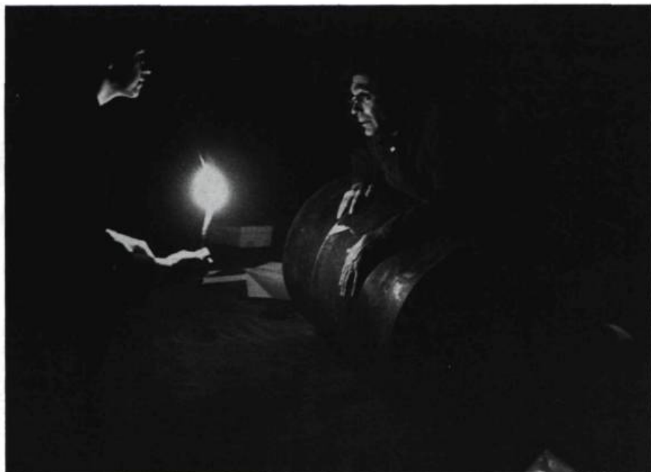
Deuxième intermède sur le temps : le Chinois s'adresse à Crawford.

Bédard et Morin, étendus chacun sur un drap aux deux coins de la scène, dorment aussi. Dans la musique qui monte, et pendant laquelle entre le Chinois, portant des draps qu'il dispose à son tour sur le sol, une voile s'élève, permettant la projection en ombres des motifs qu'appelle le rêve du vieux blanchisseur : jonque l'emportant «au pays du souvenir», maison de ses ancêtres abritant ses songes et de laquelle émergent métaphoriquement ses sœurs, enfants gazouillantes qui illustreront ses propos. Les phrases que prononce le vieil