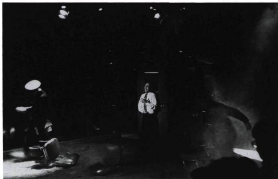
Désordre, cruauté et fureur : la fin de la valse des patineurs.

Jeanne : Le monde est un jardin prospère qui tourne autour de moi. Je ferme les yeux pour ne pas être emportée. Suspendre le temps. Comme on dit en Chine : écouter pousser les pierres et retrouver la paix. Je ferme les yeux... j'écoute : ce que j'entends, c'est un caillou dur qui grandit dans mon sein.