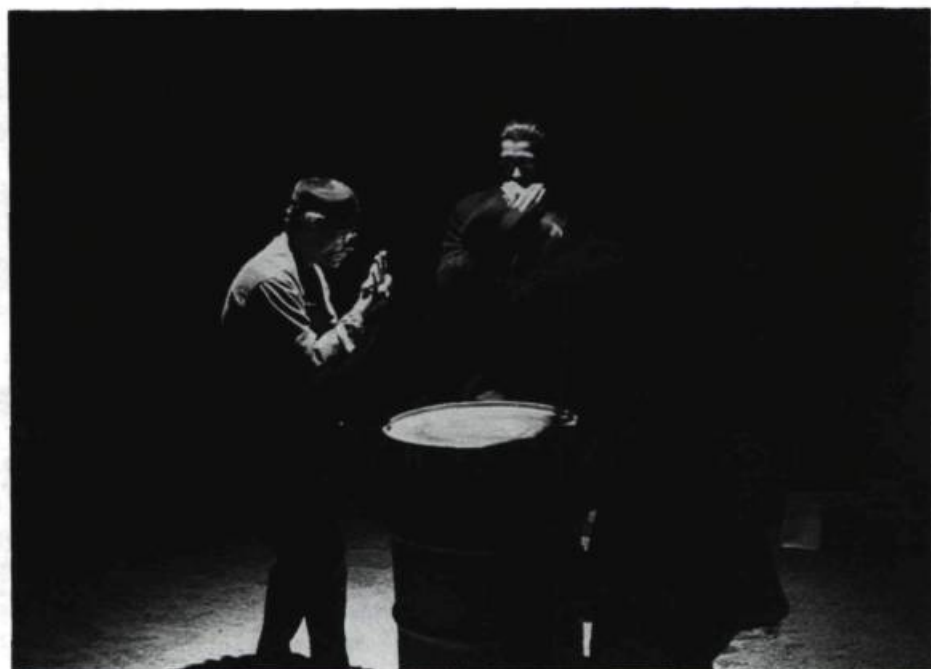
Toute en rythmes et en percussions, la partie de poker s'amorce entre le Chinois, Crawford et le croque-mort.