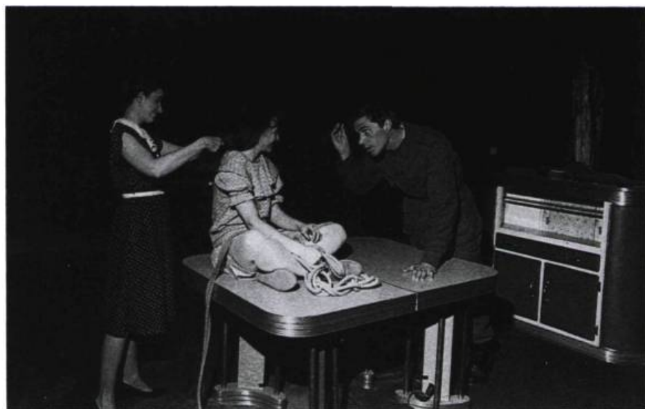
Sur la musique du tango que chante Françoise, Stella observe la chevelure de son père, de la même couleur que la sienne.