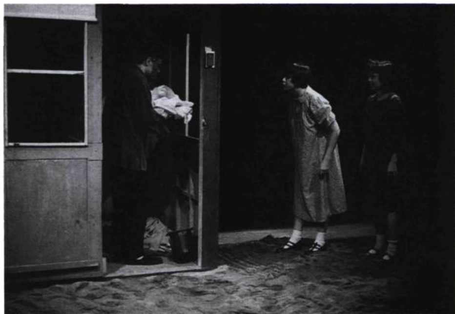
Jeanne : «Je suis venue porter les draps de mon père! Sans empois!»

Tandis que Jeanne explique à sa cousine ce que représente le papier qu'elle a reçu du Chinois («Regarde : là y fait un dessin, il le déchire en deux, y m'en donne un morceau pis