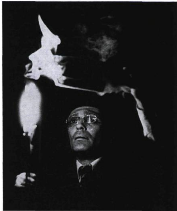
Brûlant ses souvenirs à mesure qu'il les invoque, Lee enterre symboliquement Stella.

Lépine le croque-mort va prendre Stella (toujours couchée et couverte du drap ensanglanté) dans ses bras, et la dépose dans la fosse qui l'attend près des tombes de Jeanne et de Lee. Tandis qu'il l'enterre, Lee et Jeanne, munis de chandelles, entrent avec une jonque et une maison en papier. Ils reprennent à leur compte, chacun dans sa langue, l'énumération qu'avait faite le vieux Chinois pendant son rêve, dans le Dragon vert: «le bateau qui