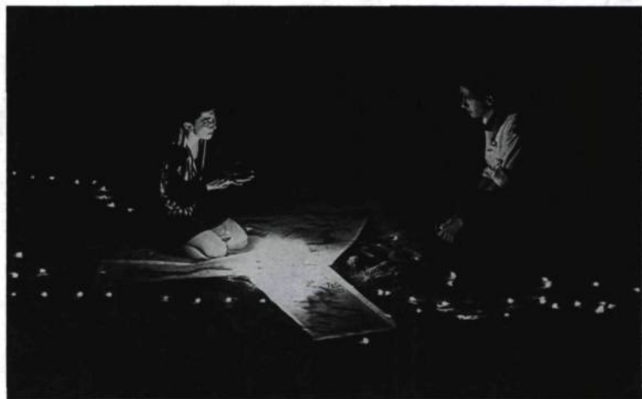
La constellation : dragons, étoiles, Orient et Occident.

Youkali : But it touches me. I am working in the space inside. Small. You are working with the space around us. You put the universe in a small room. And here, I feel safe, secure, safe in your universe.