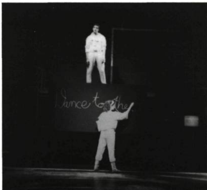
L'Instruction , Productions Germaine Larose, 1983.

Bent , Productions Germaine Larose, septembre 1981.