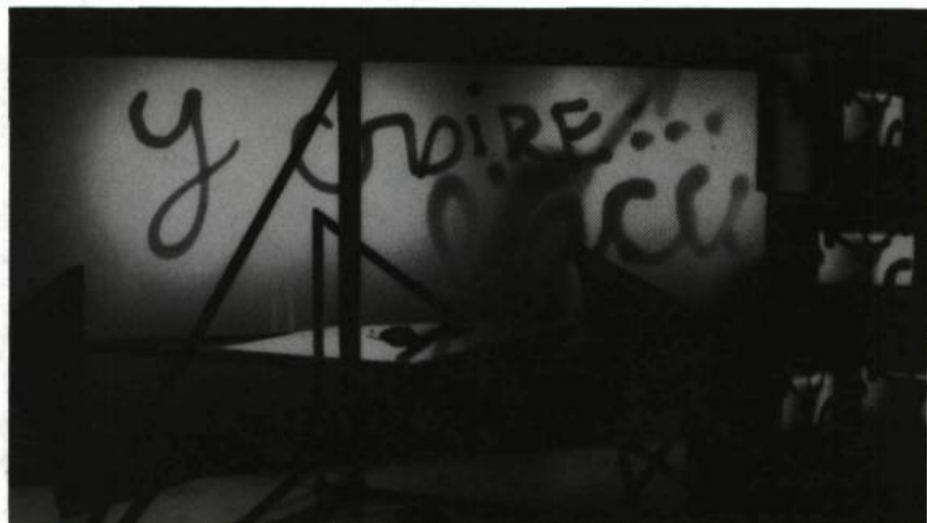
Faust : téléviseurs derrière lesquels un écran masque des personnages dont on voit les ombres écrire un message qui, pour eux, est forcément à l'envers. «Y croire»?...