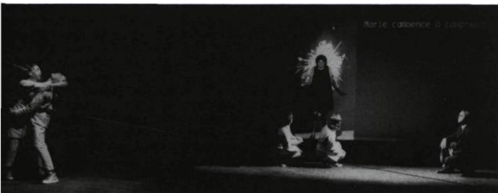
Le Système Magistère : commentaires narratifs soutenant l'action et incitant à la lire au second degré.