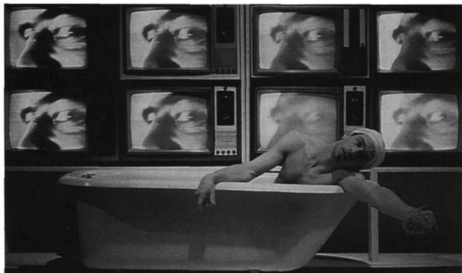
Marat-Sade , de Carbone 14, créé en avril 1984: Sade sur l'écran, Marat devant, dans une posture fortement connotée en histoire de l'art.