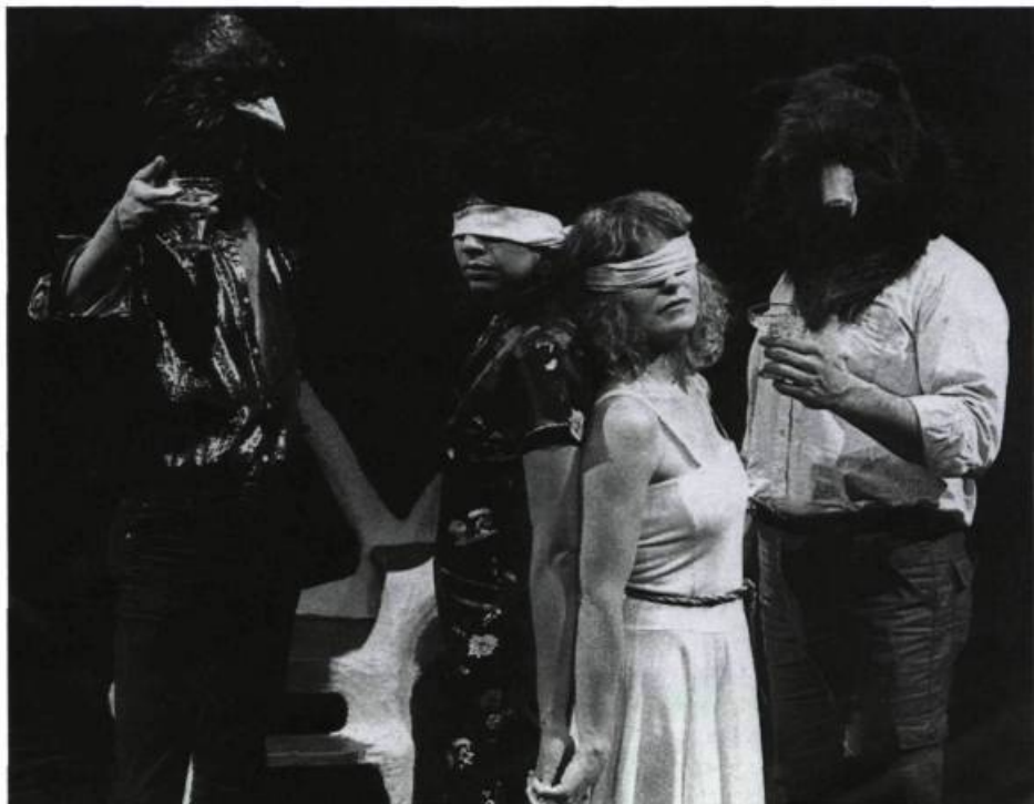
Jessica du Théâtre Passe-Muraille, de Toronto, mêlait réalisme et spiritualité.