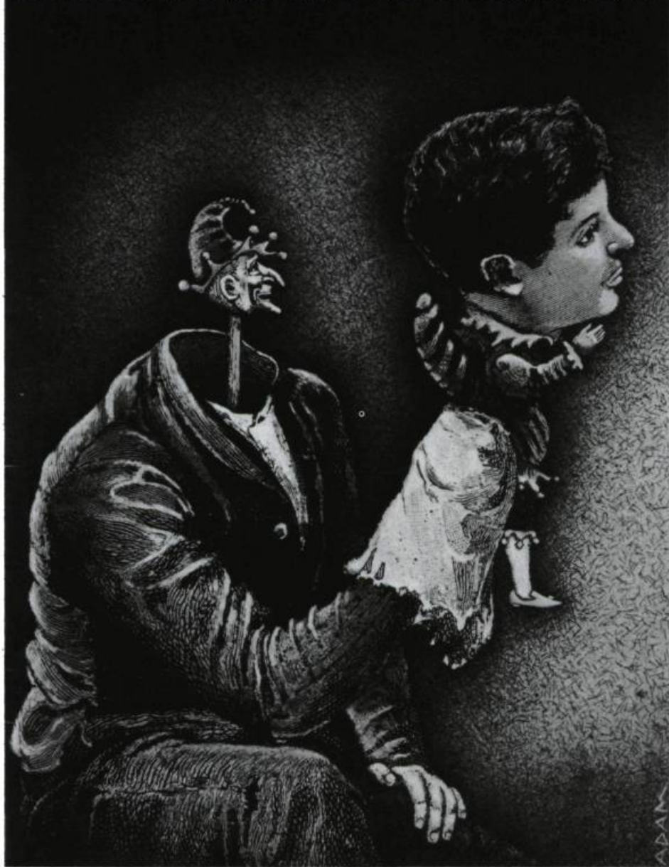
Affiche d'Yvan Adam pour la Quinzaine internationale du théâtre de Québec, 1986.