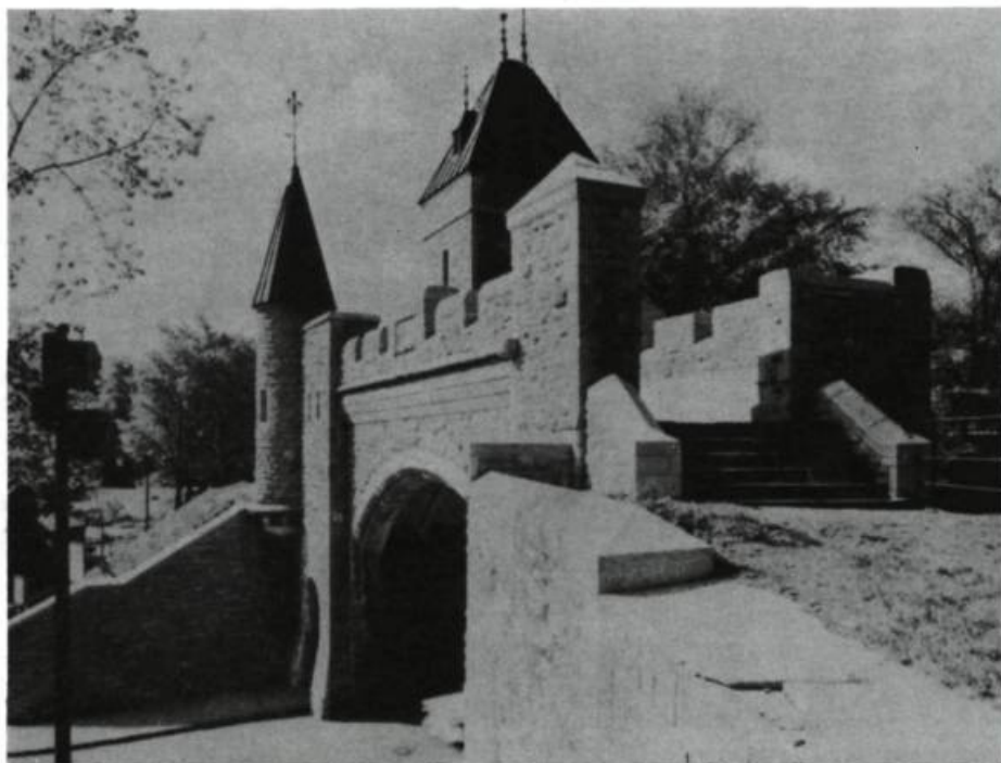
Québec, porte Saint-Louis.

Déjà décriée en 1984, cette dichotomie a pris un tour d'autant plus évident que la plupart des pièces en provenance du Canada anglais étaient cette fois groupées pendant la première semaine. Il n'en fallait pas plus pour décourager plusieurs festivaliers. Selon certains, la sélection comportait trop de pièces. Point de vue que l'on peut comprendre de deux façons. Trop de pièces pour qu'un honnête festivalier puisse tout voir en quinze, pardon, seize jours ? À ce compte, Avignon offre en un mois plusieurs centaines de spectacles ( in et