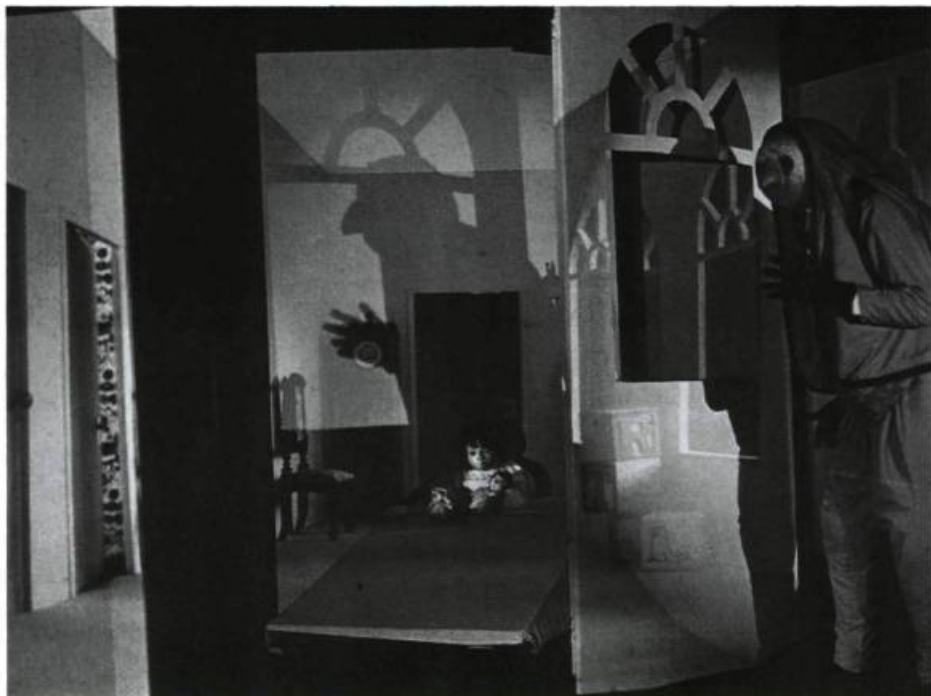
Illusion, lenteur et séduction: Auspices of Blackbirds , du Nightletter Theatre, de San Francisco.

du Pouvoir, la cruauté, le danger réel et l'agonie, pour dénoncer les totalitarismes en une cérémonie envoûtante, sauvage, à la fois grandiose et intimiste.