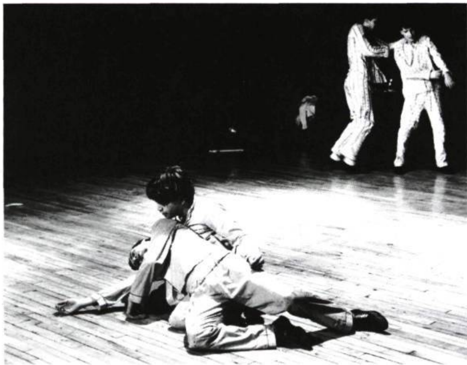
Sur l'esprit de compétition qui teinte les relations masculines: Max Masques X5 de Michel Angers.