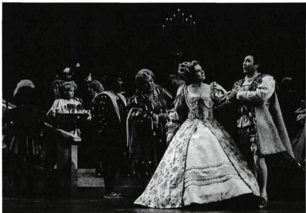
Rigoletto de Verdi, 1984.

art depuis une quinzaine d'années et qui provoque, pour ce qui est des chanteurs, un déséquilibre entre l'offre et la demande. Ainsi, des chanteurs (c'est surtout visible – audible! – chez les ténors) qui n'ont pas les qualités requises pour chanter convenablement leurs rôles ont quand même une feuille de route respectable dont Montréal, hélas!, devient une des étapes.