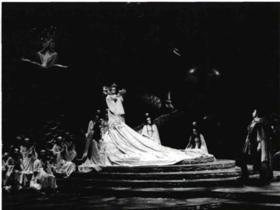
Turandot de Puccini, acte II, scène II. Opéra de Montréal, 1984.

Il y a un grave problème à l'Opéra de Montréal: on n'y a pas d'idées sur l'opéra. Pourtant, le monde musical montréalais est depuis quelques années dynamisé par le développement de pensées musicales articulées, solides: l'Orchestre symphonique de Montréal de Dutoit, le Studio de musique ancienne de Jackson et Poirier, l'Ensemble I Musici de Turovski, la Société de musique contemporaine du Québec de Garant sont autant de voix dont l'intérêt vient d'un rapport défini à leurs répertoires musicaux respectifs. Or, cette dynamique interne, nécessaire à toute entreprise artistique digne de ce nom, est, de toute évidence, absente de l'Opéra de Montréal. Sinon, comment expliquer l'éclectisme — confinant à l'à-peu-près — qui caractérise ses saisons?