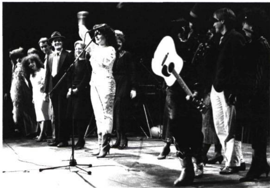
Soirée d'ouverture de l'Implanthéâtre, le 24 mars 1985.

toujours utilisée à l'italienne. Il est vrai, cependant, que son coût de transformation est exorbitant. Actuellement, seul le Conservatoire d'art dramatique de Québec utilise de façon renouvelée les installations de sa salle lors des exercices pédagogiques des étudiants. Pourtant, le Conservatoire ne possède pas la salle la plus appropriée à l'éclatement scénique. Par contre, les professeurs savent proposer aux étudiants une utilisation maximale du décroisement de la salle à l'italienne. Malheureusement, quand ils accèdent à la pratique professionnelle, peu d'entre eux poursuivent une telle recherche sur l'espace scénique. Le Théâtre Repère a cependant réussi, l'hiver dernier, à utiliser un nouvel espace scénique, dans un lieu que le théâtre n'avait encore jamais atteint, en présentant À propos de la demoiselle qui pleurait , une pièce d'André Jean mise en scène par Robert Lepage. 1 Une production aussi audacieuse dans l'utilisation de l'espace pourrait faire rêver, en tout cas, les « acquéreurs » de l'Implanthéâtre. . .