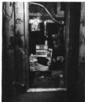
New York: visages et aspects à la fois fascinants et terrifiants.