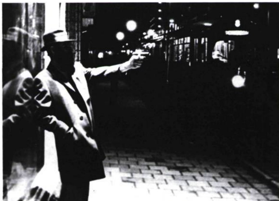
« Un homme s'effondre. . . sur le bord de la vitrine. Le duel se poursuit. » Pig Child Fire , 1977.

Dans le Prince Constant , la quasi-nudité du prince (un simple pagne de tissu blanc et une chemise blanche dont il va se dévêtir) n'appelle pas à la jouissance sexuelle du public ni même à la brisure d'un tabou. Elle est ici métaphore d'une nudité de l'esprit