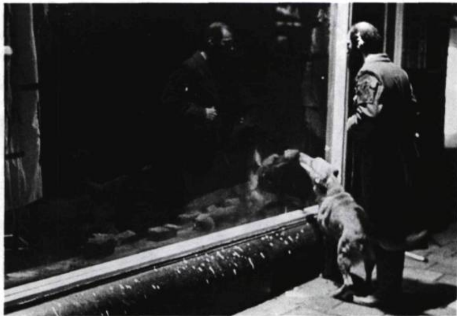
Pig Child Fire du Squat Theatre, en 1977. « Dehors, un homme tient en laisse un chien policier, tandis que la manche de sa veste brûle . . . »

Quand le rideau s'ouvre à nouveau, le pendu a disparu du champ de la vitrine. De part et d'autre de la rue, deux hommes armés, bras tendus. Des haut-parleurs diffusent la musique du groupe allemand Kraftwerk: « Nous sommes des mannequins » (au rythme épique, mécanique et funèbre). Une femme armée tue l'un des protagonistes. Un homme pointe son revolver et tire. Un homme s'effondre . . . sur le bord de la vitrine. Le duel se poursuit. (Voir photo.) Atmosphère lugubre, pénombre. De manière inattendue, l'homme du lointain s'approche de la boutique, constate le décès de son opposant, tire à travers la vitrine et tue la femme meurtrière, dedans.