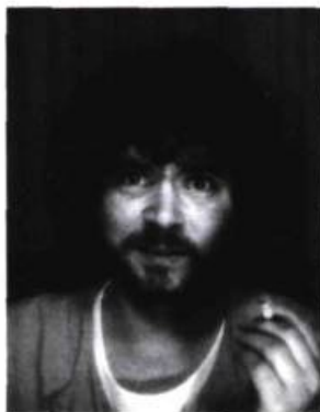
Ah non, j'y vais pas!