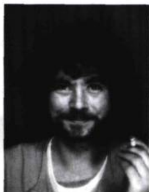
Ah pis oui: J'Y VAI!

La secrétaire de la rédaction, à huit heures par semaine, pendant cinquante semaines ferait: 400 heures par an. L'intendant, lui, à 10 heures par semaine pendant le même temps: 500 heures.