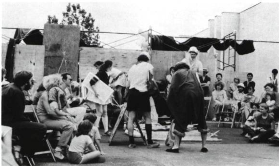
«Tous pour un, un pour tous!» Les enfants construisent leur cabane.

les participants 7 , s'est révélé le déclencheur d'une énergie et d'un travail novateurs. L'esthétique particulière du Nouveau Théâtre Expérimental (le jeu « primitif », les costumes et les décors « faits maison », l'adaptation à toutes les situations et à tous les lieux, l'obligation qu'on se donne d'« être génial avec peu de moyens ») et le travail en autogestion auront permis la concrétisation, en si peu de temps et dans un contexte aussi perturbé, d'un produit théâtral remarquable, tant dans sa réalisation que dans son processus de création.