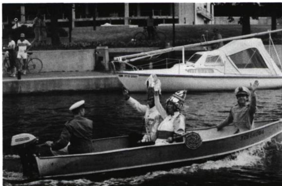
« Théâtraliser ce qu'on avait trouvé de mieux » : un boyau de plastique et « teuf teuf teuf » pour l'hélicoptère, une chaloupe à moteur sur le canal Rideau pour l'arrivée triomphante de la papesse Jeanne.