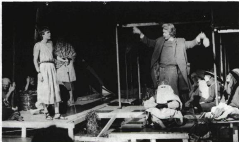
« La scénographie de la pièce VI a comme origine des trous dans un plancher... »

les goûts et les compétences de chacun 15 . Mais la structure était souple et les aller et retour, fréquents. Certains travaillaient dans deux cellules ou allaient de l'une à l'autre. Chaque sous-cellule jouissait d'une grande autonomie pour réaliser, dans son secteur, les buts que le groupe s'était fixés et pour explorer les a priori du metteur en scène qui, s'il ne possédait pas toutes les solutions à tous les problèmes, savait clairement, par contre, ce qu'il ne voulait pas, ce qui n'allait pas dans le sens de l'oeuvre.