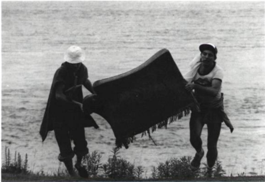
« L'adaptation à toutes les situations et à tous les lieux. »

romanichels dépenaillés, revêtus de près de 800 costumes et éléments de costumes, jouant avec plus de 800 accessoires, tous plus hétéroclites et étonnants les uns que les autres, vivant et se déplaçant dans un univers de toiles et de cartes immenses, dessinées à la main, dans des lieux aussi divers et éloignés que l'Abitibi, l'Azerbaïdjan et le Pôle Nord, en compagnie d'acteurs excentriques: Gwendoline la tortue et Jeanne la cane.