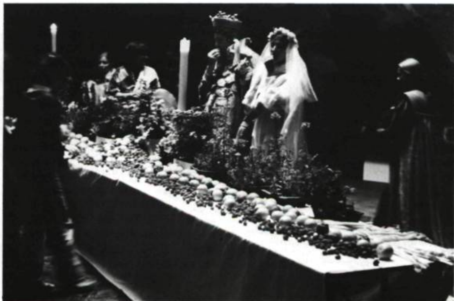
Le repas nuptial: à la frontière du théâtre et de la vie.

L'accidentel et la nécessité ont beau avoir formé le spectacle du Roi Boiteux , il y avait néanmoins chez les participants des canons esthétiques, à la fois précis et diffus, qui les guidaient dans le choix des costumes, des accessoires et des éléments du décor. Une des clefs de cette esthétique gîte dans le texte et prend sa source dans l'ambiguïté qui entoure la nature réelle des personnages qui animent le cycle du Roi Boiteux . Sont-ce de réels monarques ou sont-ce de pauvres diables, d'humbles gens qui n'ont jamais quitté leur rue et qui passent leurs étés sur leurs balcons? L'ambiguïté réside dans l'opposition entre ces deux pôles comme dans ce qui les lie. Car ces monarques, leur vie, leurs occupations, semblent avoir été rêvés par des gens pour qui leur quartier (l' Arsenal?), ce qu'on y trouve et la vie qu'on y mène, est la seule mesure de l'Histoire et du monde. Laurent Lapierre, à ce sujet, parle du Roi Boiteux comme l'expression d'une « mégalomanie des petits ». Cette idée d'un faste royal imaginé par des gens dont la vie matérielle limite sérieusement l'imaginaire — avec tout ce qu'on peut y projeter de mauvais goût — a, en quelque sorte, guidé ce qui allait devenir, pour les artisans du spectacle, le « québécois Roi Boiteux ». Particulièrement sensible dans les costumes, le « québécois Roi Boiteux » célébrait la ren-