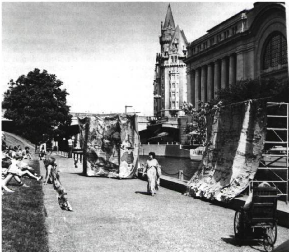
L'exploitation maximale des lieux.