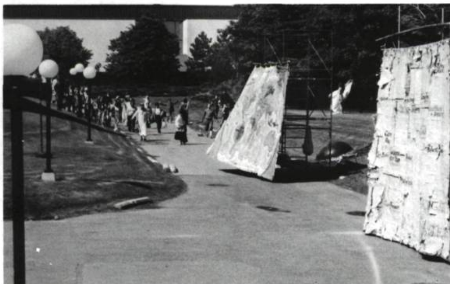
L'Expo-Théâtre de Montréal, le 24 juin 1982: le début du cycle.