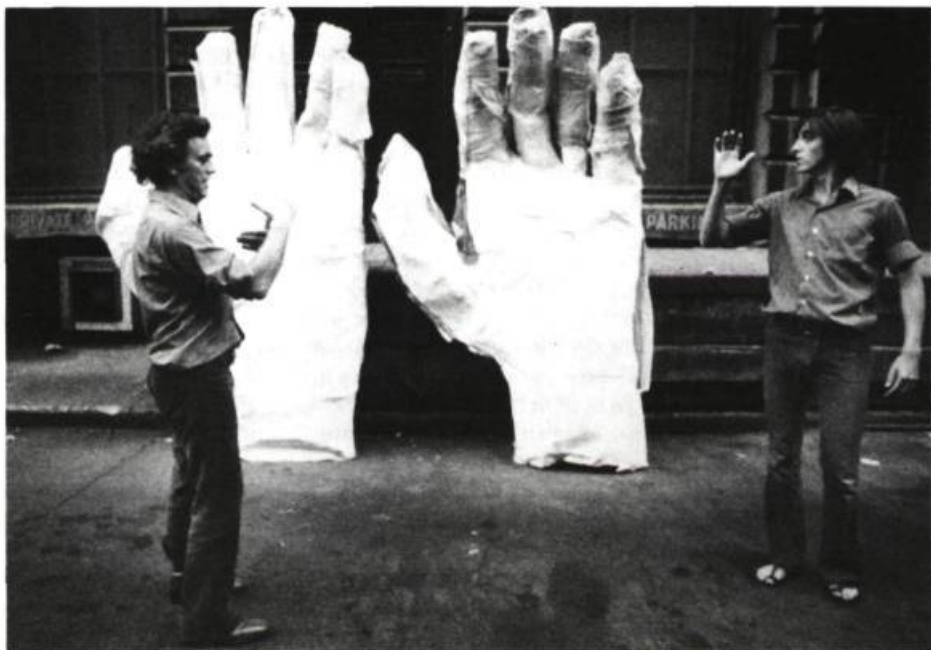
« Comment ça se joue, le tir au poignet? », tableau de la Grande Décollation de saint Jean-le-Creux , présenté dans les rues du Vieux-Montréal, à l'occasion des fêtes de la Saint-Jean-Baptiste en 1970. Deux ans

Il y a une question troublante qui touche les nouveaux metteurs en scène, disons les metteurs en scène à la mode. Comment se fait-il aujourd'hui à travers le monde que