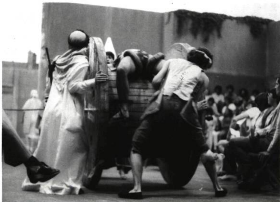
Contre le théâtre calfeutré: Vie et mort du Roi Boiteux dans les cours de l'École nationale de théâtre à l'été 1981, production du Nouveau Théâtre Expérimental.

contraindre, les falsifier ou les étouffer dans l'exercice de son pouvoir.