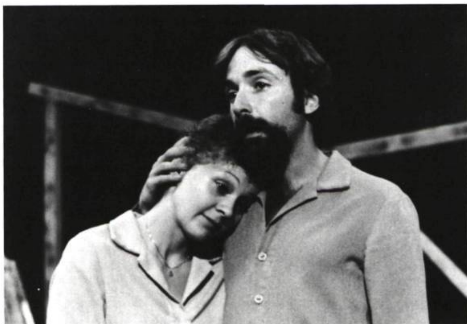
Le soleil tourne autour de la terre, pièce écrite pour l'Union théâtrale des Jeunes Témiscamiens.