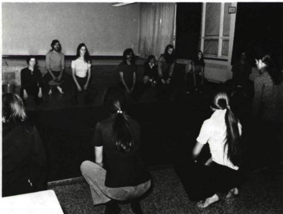
Ateliers d'étudiants de l'Option-Théâtre, Université de Sherbrooke.

que l'étudiant doit connaître beaucoup de choses en éclairage, parce qu'il travaillera très rarement dans des lieux qui disposent d'un système d'éclairage complexe. Si l'étudiant comprend assez bien le système d'éclairage dont on dispose dans la Petite Salle du pavillon central, il en a suffisamment pour travailler avec n'importe quel groupe de non-spécialistes. Pour les décors, c'est la même chose. Je ne sais pas comment planter un clou, mais je peux parler avec quelqu'un qui sait planter des clous et je peux l'aider à concevoir le décor. Dans un groupe de non-spécialistes, j'ai bien des chances d'être avec des gens qui se débrouillent bien avec l'électricité ou la menuiserie ou la couture. Si je sais ça, tant mieux, c'est un avantage pour moi, mais l'étudiant n'a pas besoin de sortir en sachant parfaitement bien toutes ces techniques. Ce qu'il a besoin de savoir, c'est comment il va pouvoir utiliser les ressources du groupe pour faire les costumes, par exemple.