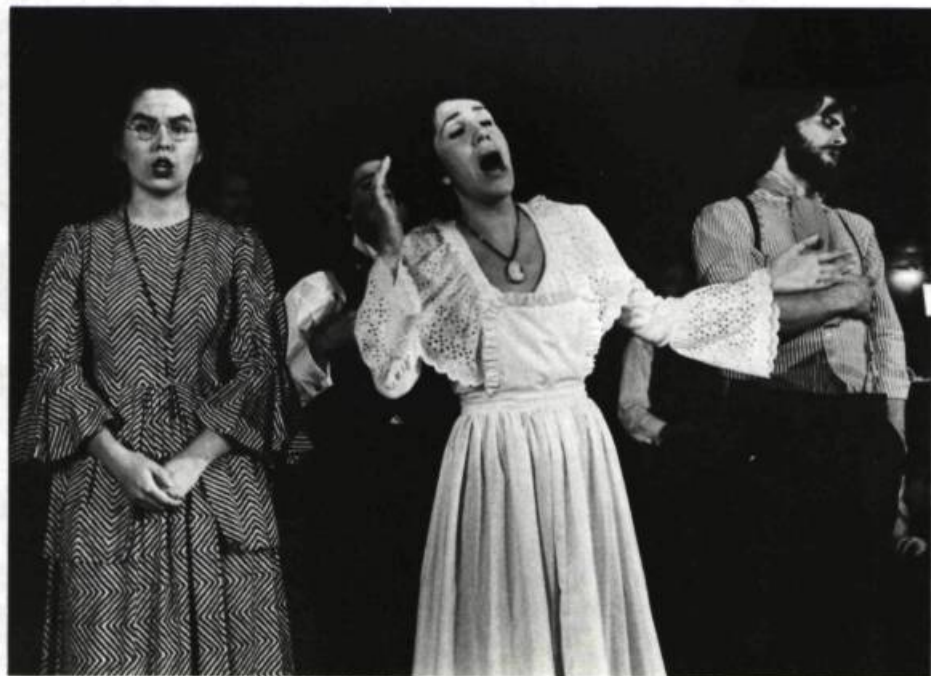
Madeleine a fait un bal. Texte et mise en scène d'Hervé Dupuis.

H.D. — Oui, je pense qu'il y en a qui le font. Je ne prétends pas que tous les