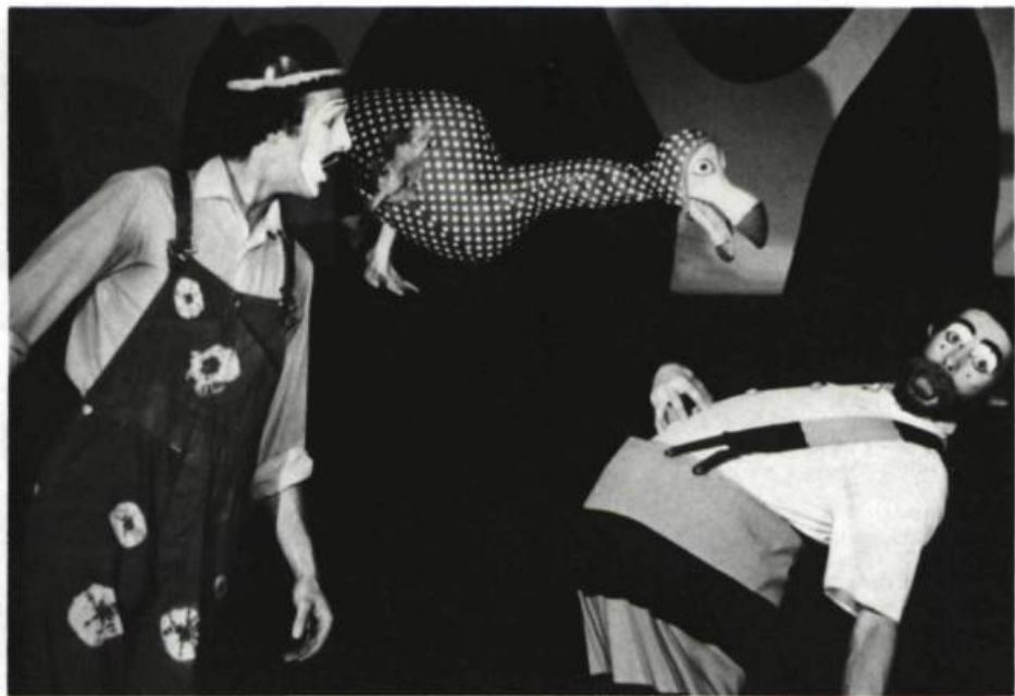
Tohu-bohu , le Théâtre de l'Oeil, 1976.