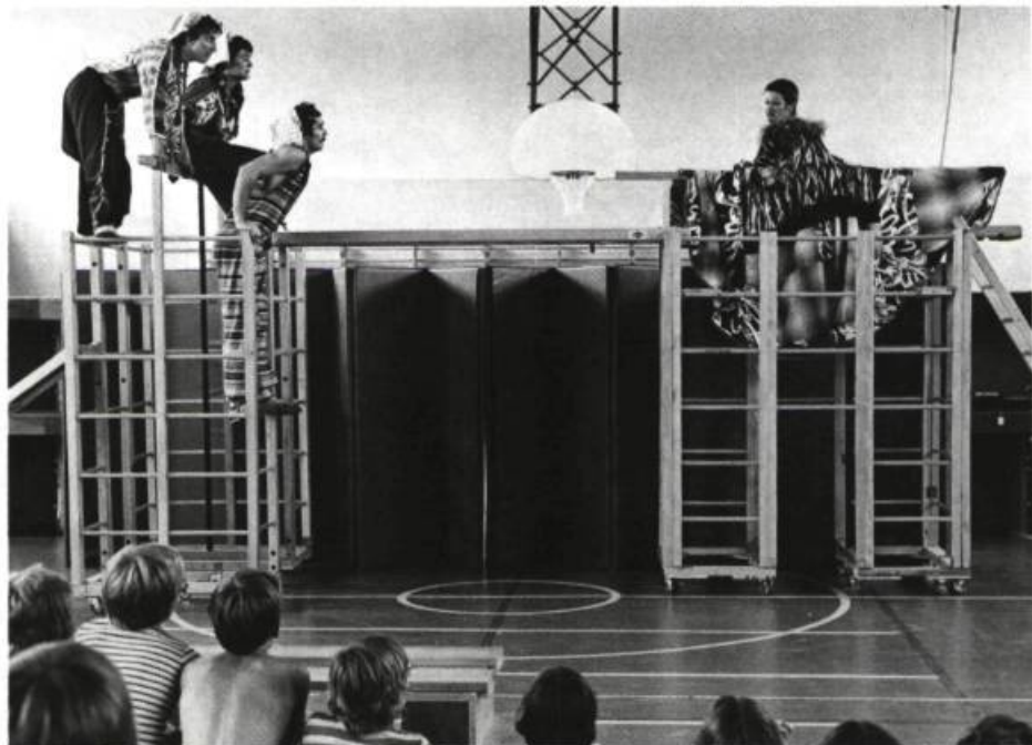
L'Âge de Pierre , création collective du Théâtre de la Marmaille. Été 1978.