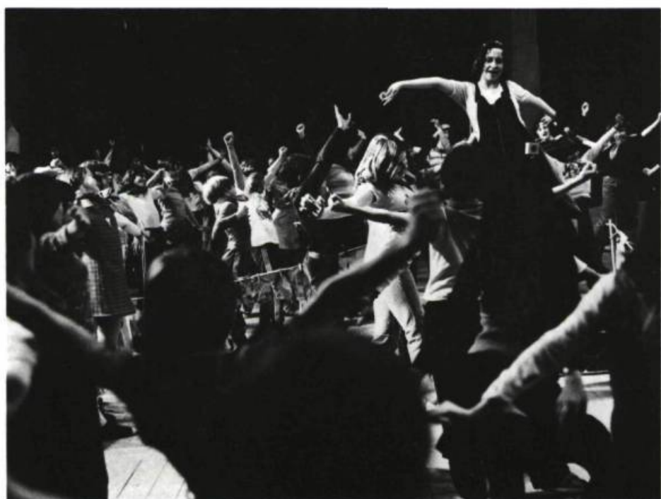
A quoi qu'on joue? Atelier du théâtre de la Marmaille, 1976.