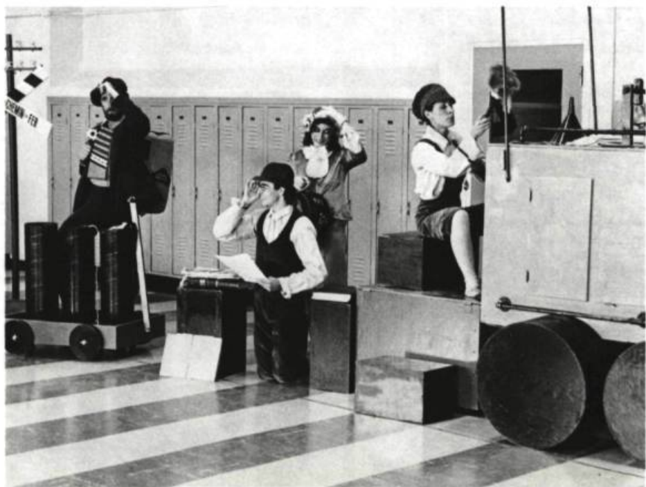
La Chanson improvisée , le Caroussel, 1978.