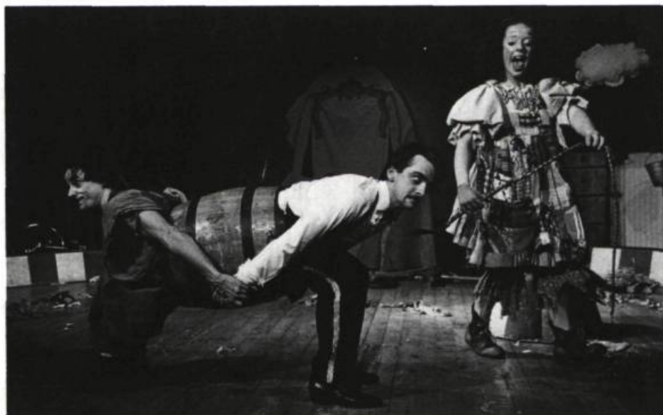
Chatouille et Chocolat à la besogne , 1974.