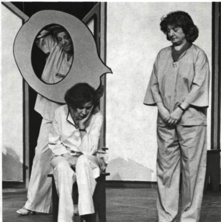
Un pied à terre, l'autre dans la rue, création collective. Les Trésors oubliés, 1979.