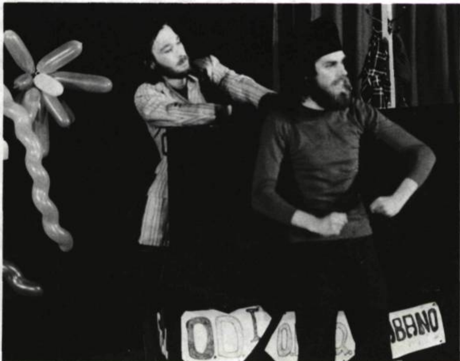
Les Marchands de ballounes, les Gens d'en Bas, 1976.

14. Que soit formé un Comité d'action politique, lieu permanent d'échange idéologique [sic], dont la tâche principale sera de rendre publique et permanente toute forme de débat idéologique relié aux actions entreprises par l'A.Q.J.T. et qui ferait avancer celle-ci dans ses objectifs culturels et politiques.