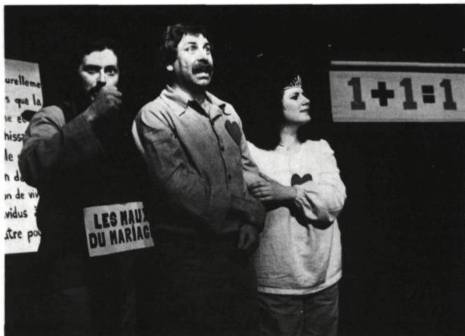
Moi, c'est moi, pis toi t'es toi, le Cent-Neuf. (Photo: François Huot).