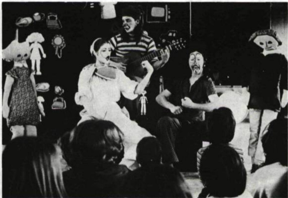
L'amour, c'est des toasts, la Bébelle, 1978.