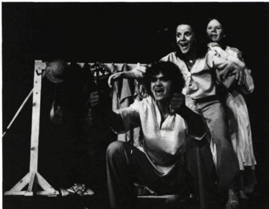
Laissez la marge libre s.v.p.. Théâtre à mitaine, à mi-temps. Victoriaville, 1979.

qu'une motion de blâme soit adressée au Gouvernement du Québec à la suite de la demande de son ministère des Affaires culturelles faite à l'Association de s'autofinancer partiellement; nous dénonçons l'ingérence abusive du ministère des Affaires culturelles dans la vie interne des organismes qu'il subventionne.