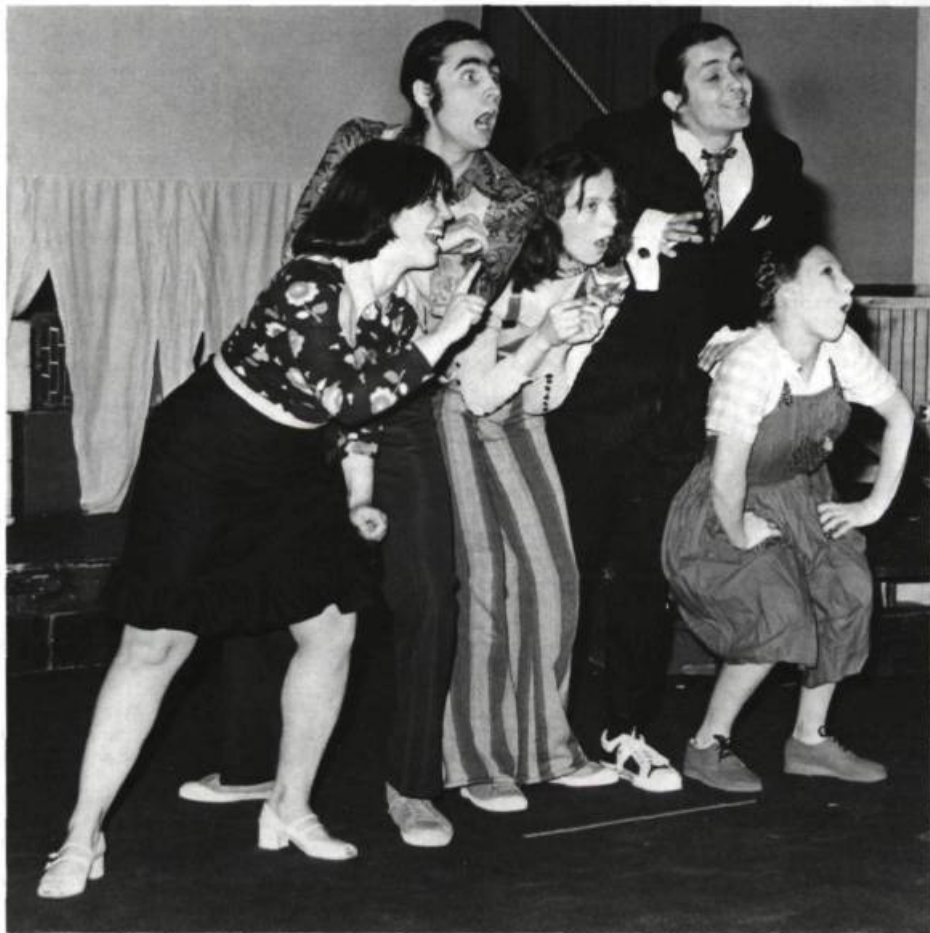
Toujours plus gros, création collective du Parminou, 1976.

14. Attendu qu'il est urgent de solutionner les problèmes de survie et de compétition entre les troupes;