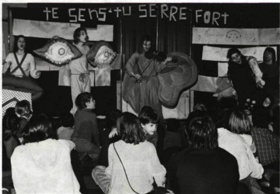
Te sens-tu serré fort? Théâtre de Carton, 1978.