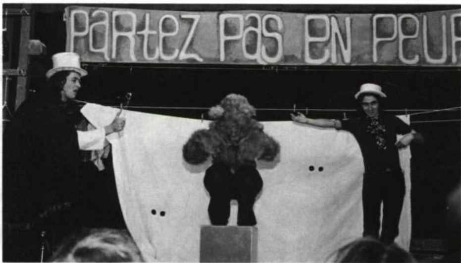
Partez pas en peur, le Théâtre Parminou, 1978.