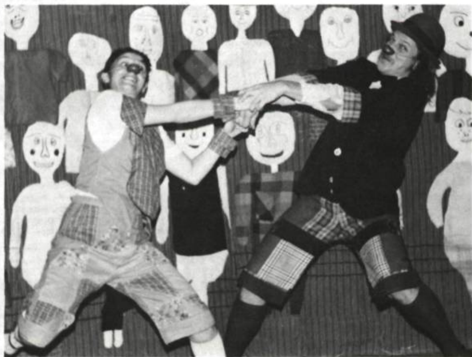
Chômeur Circus, Théâtre de la Riposte, 1979.

attendu que l'A.Q.J.T. n'est pas une succursale du ministère des Affaires culturelles;