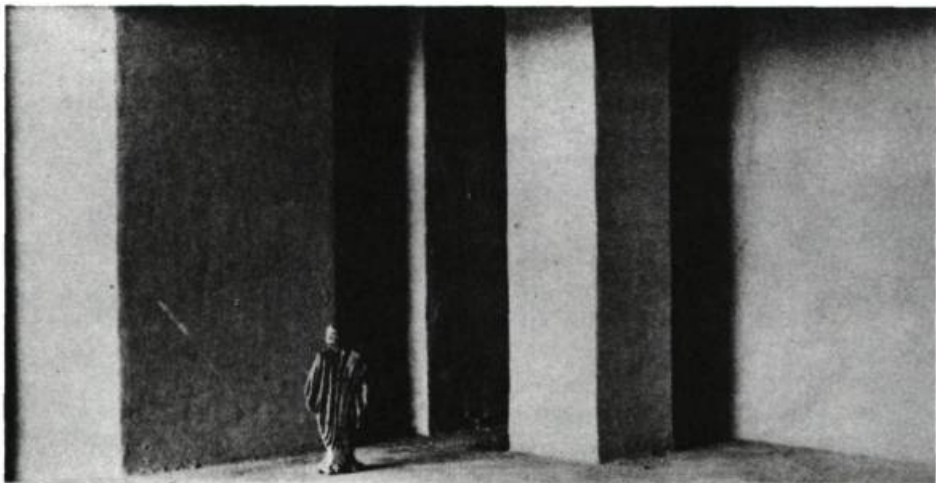
E.G. Craig. Maquette pour Hamlet , Théâtre Artistique de Moscou, 1912.

ments dans un temps proprement théâtral;