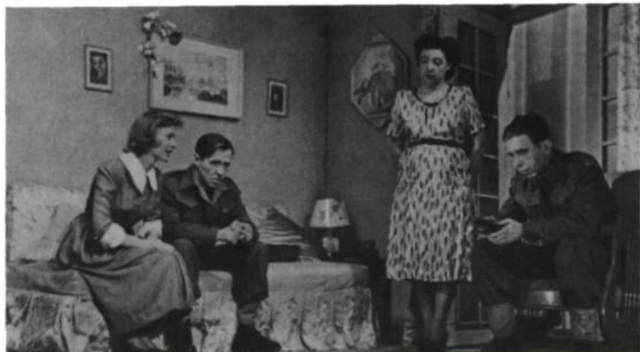
Tit-Coq , pièce de Gratien Gélinas, créée au Monument National, à Montréal, le 22 mai 1948.