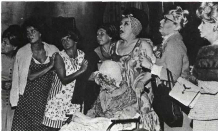
Les Belles-Soeurs , pièce de Michel Tremblay, créée au théâtre du Rideau-Vert, à Montréal, le 28 août 1968.

mons, mais nous nous imposons de faire des créations québécoises." En d'autres termes, créer une pièce québécoise est un pensum dont on se débarrasse le plus vite possible pour pouvoir retourner aux choses sérieuses. Pensum pour les directeurs artistiques, pensum pour les metteurs en scène et, à quelques exceptions près, pensum pour les comédiens; il ne faut pas s'étonner si les productions des pièces québécoises reflètent et communiquent aux spectateurs l'ennui que les artisans du théâtre ont eu à les monter. Les Belles-Soeurs n'ont pas connu le succès qu'elles ont connu, uniquement parce que la pièce était une bonne pièce.