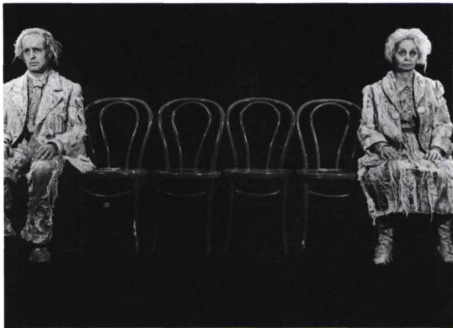
Les chaises de Eugène Ionesco, production du T.N.M.