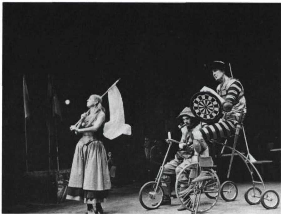
Quichotte , adaptation de Jean-Pierre Ronfard, (en tournée), production des Jeunes Comédiens du T.N.M.

La musique est un art populaire par excellence. Woodstock ou l'Île de Wight sont des phénomènes de rassemblement et des événements. Le cadre est changé. Il faut aller ailleurs que dans les temples de la culture et faire éclater même les cadres physiques de la représentation. Je crois en la possibilité de faire, ailleurs que dans les théâtres, des créations théâtrales importantes. Mais pour que le théâtre devienne véritablement une fête, il faut explorer une mythologie qui puisse être partagée par l'ensemble des spectateurs. Le Bread and Puppet en est une illustration. Le problème du théâtre populaire, c'est qu'il est difficile d'en prévoir le phénomène. Faire quelque chose pour que ça soit po-