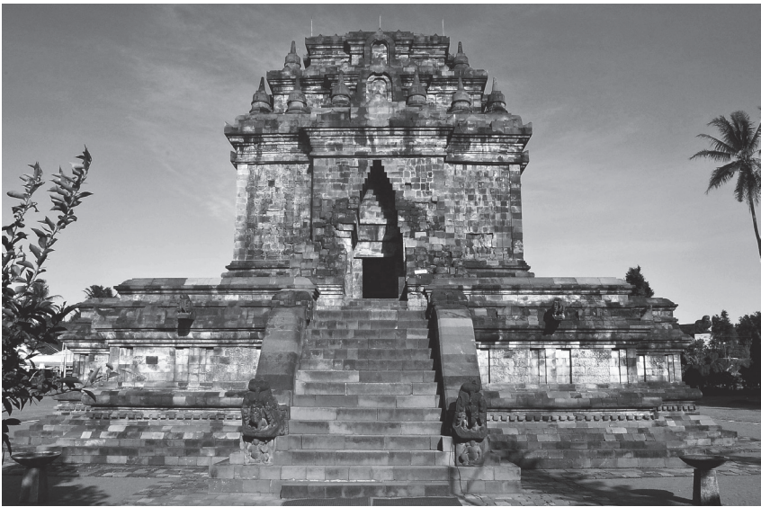
Figure 1. Temple de Candi Mendut, août 2016.

On a découvert une représentation de ce conte dans l'un des plus célèbres temples bouddhistes d'Indonésie, sur l'île de Java, à savoir le temple Candi Mendut, qui date du IX e siècle. Les murs de l'escalier menant à la salle où trône le Bouddha sont ornés de bas-reliefs, dont l'un concerne notre histoire. Dans les illustrations ci-dessous, dans l'image du haut, le mur de l'escalier montre cette scène dans le coin du bas à droite.