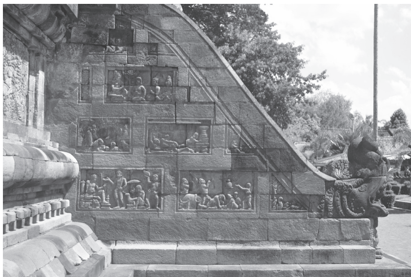
Figure 2. Côté de l'escalier de Temple de Candi Mendut, août 2016.