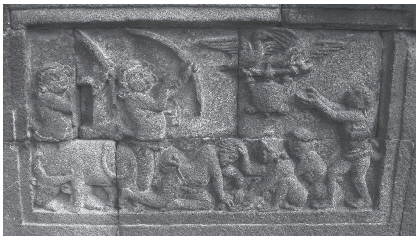
Figure 3. Plus proche au côté de l'escalier de Temple de Candi Mendut, août 2016.

Les fables bouddhistes sont arrivées jusqu'en Europe par les canaux du folklore oral, probablement par l'intermédiaire de traductions persanes et surtout arabes, et elles ont considérablement