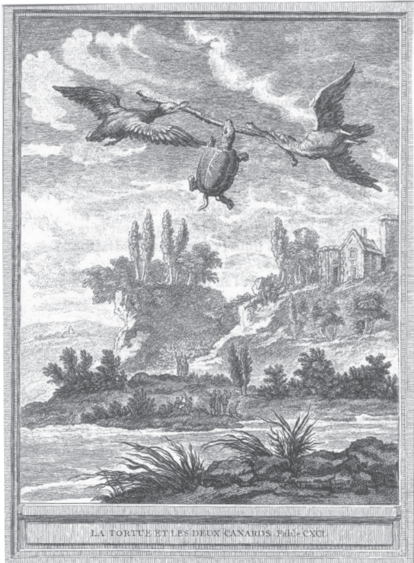
Figure 4. Une illustration de Jean-Baptiste Oudry accompagne l'édition originale de cette fable 25 .

vole. La Fontaine a recouru à la licence poétique pour faire de la tortue, non pas un personnage qui appelle ses amis à l'aide pour lui trouver un nouvel endroit où vivre, puisque sa mare se desséchait, mais une aventurière qui désire voir le vaste monde.