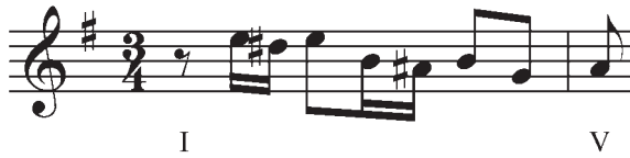
Exemple 2. Exemples de motifs créés par l'apprenant à partir du même concept fondamental