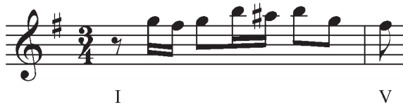
Exemple 1. Exemple de motif à mémoriser avec broderie inférieure chromatique

nouveaux motifs en temps réel, en respectant toujours le concept fondamental en apprentissage.