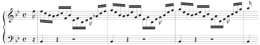
Figure 4. Partita #1 en sib Majeur, Allemande, mes. 1—4

Adolescent, lorsque j'étudiais le piano, j'étais plutôt mauvais élève parce que je passais plus de temps à « contempler » le son des pièces qu'à les travailler. J'aimais beaucoup, par exemple, isoler des passages contenant des sonorités inhabituelles, sonorités le plus souvent créées par des processus de conduite de voix comme des notes de passage, des retards, ou des appoggiatures ; sonorités que l'on remarque moins (ou pas du tout) si l'œuvre est jouée « normalement ». Prenons pour exemple ce court extrait du choral, qui prend une allure bien différente lorsqu'on s'amuse à faire des « arrêts sur image », c'est-à-dire soutenir des accords qui ne sont pas faits pour être soutenus (indiqués ici par des points d'orgue de petite taille).