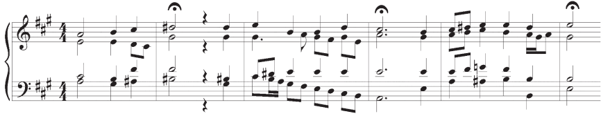
Figure 3. Choral Es ist genug! , mes. 1—6