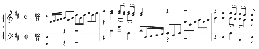
Figure 2. Clavier bien tempéré , Deuxième livre, Prélude # 5, mes. 1–4

Les premières étapes de la composition de l'œuvre ont donc été marquées par un travail de terrain pour lequel j'étais moi-même le sujet d'étude : je me suis installé au piano et ai passé en revue toutes les pièces de Bach que j'ai déjà jouées et aimées. J'en ai choisi trois : le Cinquième Prélude du Deuxième livre du Clavier bien tempéré , une harmonisation du choral Es Ist Genug 11 et l' Allemande de la Partita # 1 en sib majeur .