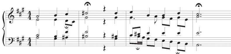
Figure 5. Choral Es ist genug! , mes. 1—4, avec dissonances soutenues

Adolescent, lorsque j'étudiais le piano, j'étais plutôt mauvais élève parce que je passais plus de temps à « contempler » le son des pièces qu'à les travailler. J'aimais beaucoup, par exemple, isoler des passages contenant des sonorités inhabituelles, sonorités le plus souvent créées par des processus de conduite de voix comme des notes de passage, des retards, ou des appoggiatures ; sonorités que l'on remarque moins (ou pas du tout) si l'œuvre est jouée « normalement ». Prenons pour exemple ce court extrait du choral, qui prend une allure bien différente lorsqu'on s'amuse à faire des « arrêts sur image », c'est-à-dire soutenir des accords qui ne sont pas faits pour être soutenus (indiqués ici par des points d'orgue de petite taille).