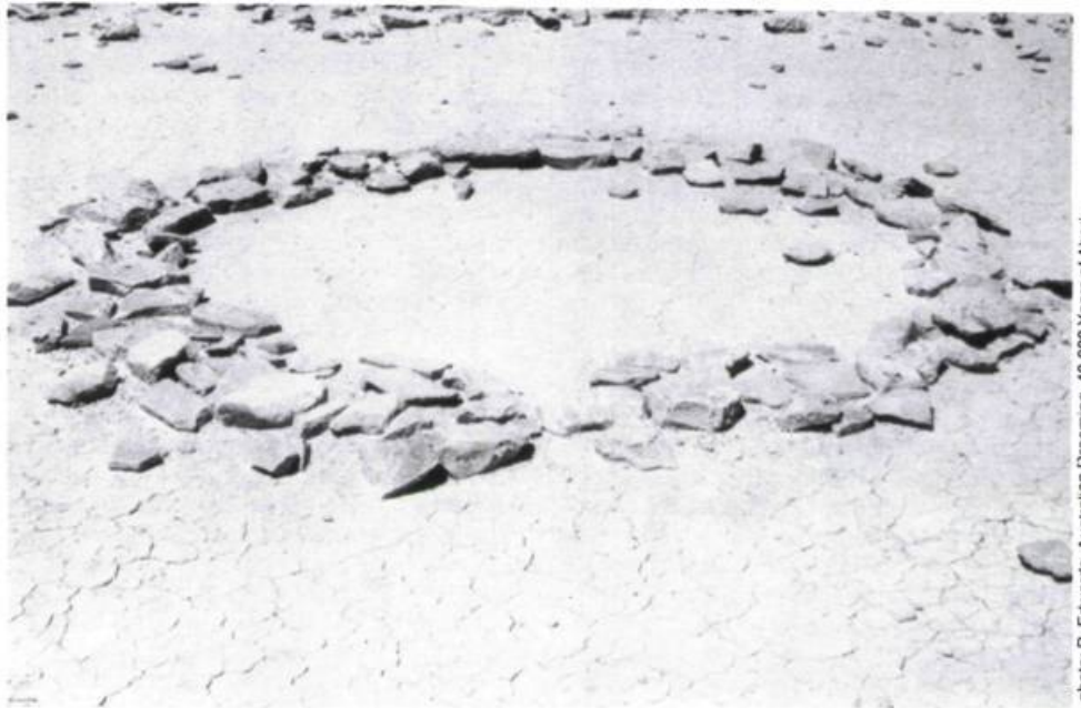
Arrangement circulaire de pierres: Aborigènes de l'Australie Centrale

Le désert, vaste et immense, que l'on qualifie par ignorance de terre inculte révélera pourtant des richesses inconnues à celui qui a le temps. Avec ces hommes et ces femmes du désert, j'ai chassé l'iguane, le kangourou et le serpent; avec eux, j'ai creusé le long des lits de rivières asséchées pour y trouver des grenouilles; j'ai cueilli les fruits sauvages, l'igname et les graines à moulin pour le pain. Et plus encore, ils m'ont appris l'art des pistes, ces dessins sur le sable où se lit le message du transitoire et de l'éphémère. Un message de vie; seul celui qui saura en décoder le processus trouvera la clé de sa survie.