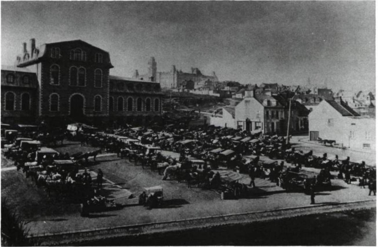
—Louis-Prudent Vallée «Le marché Montcalm» I.B.C. Fin 19e