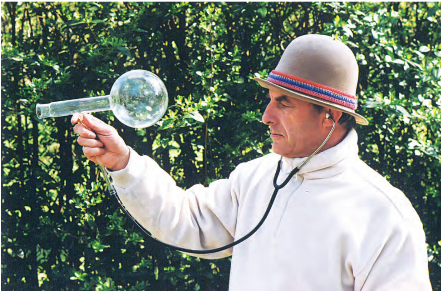
> Prothèse avec chambre – Opus 125, 1995. Instrument d'écoute pour entendre les sons du monde comme si on était dans une sphère.