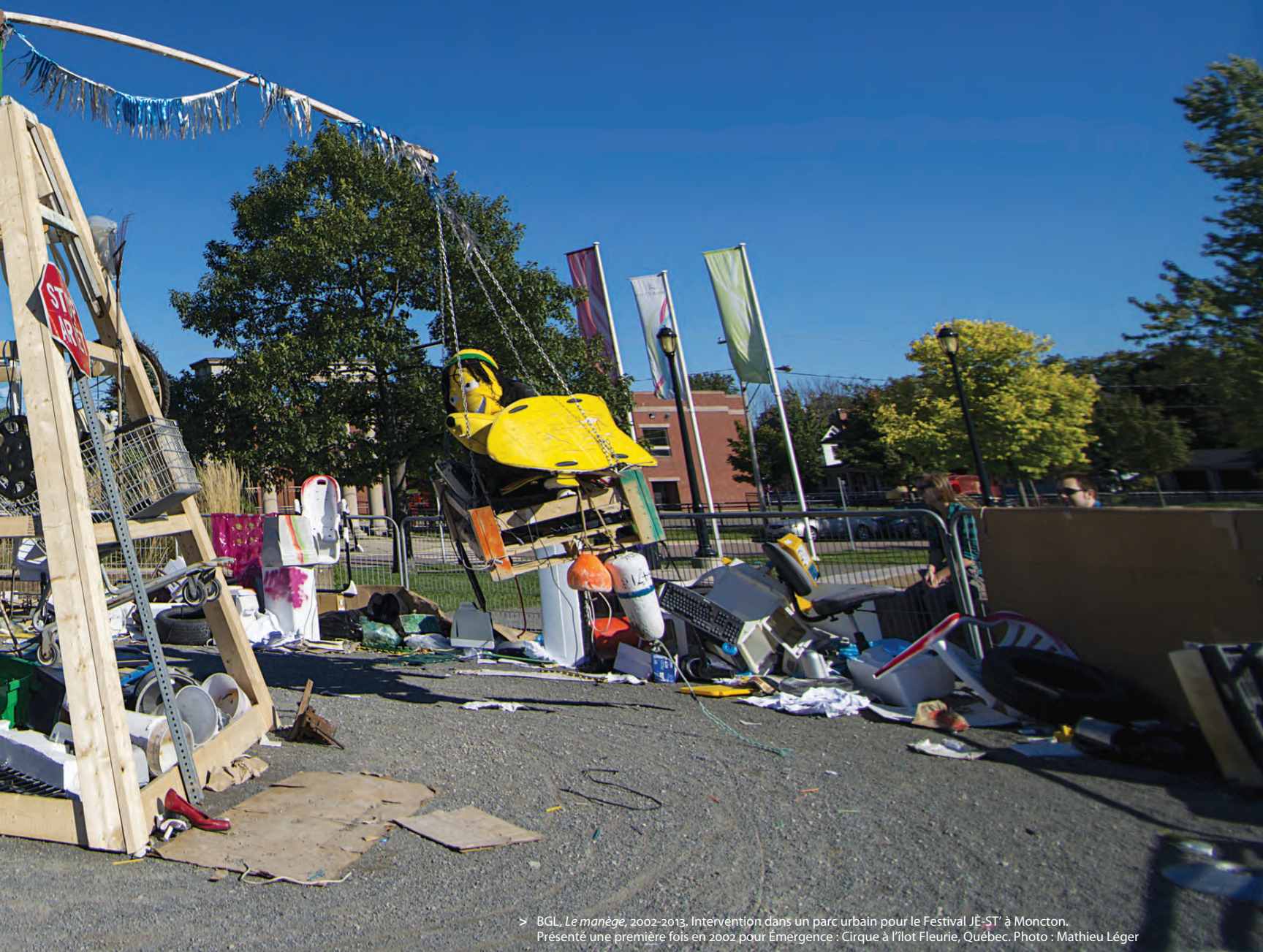
> BGL, Le manège, 2002-2013. Intervention dans un parc urbain pour le Festival JÉ-ST' à Moncton. Présenté une première fois en 2002 pour Émergence : Cirque à l'îlot Fleurie, Québec.