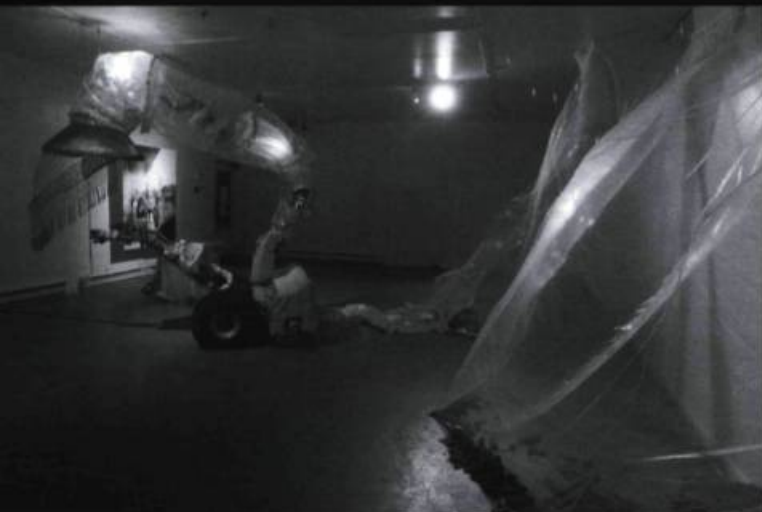
h_Julie-Andrée T, Zones amères et/ou La mise en page d'un univers clos , du 9 avril au 3 mai 1998.