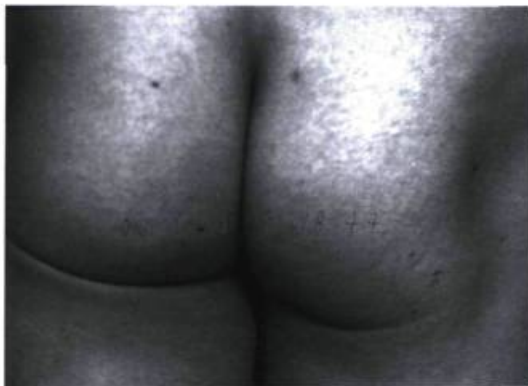
Arnaud Labelle-Rojoux Leçons de scandale