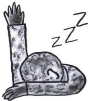
On peut contacter Asiatopia et Chumpon APISUK à

Concret House 57/60 Tivanond Road Nonthaburi, 11000 Thaïlande