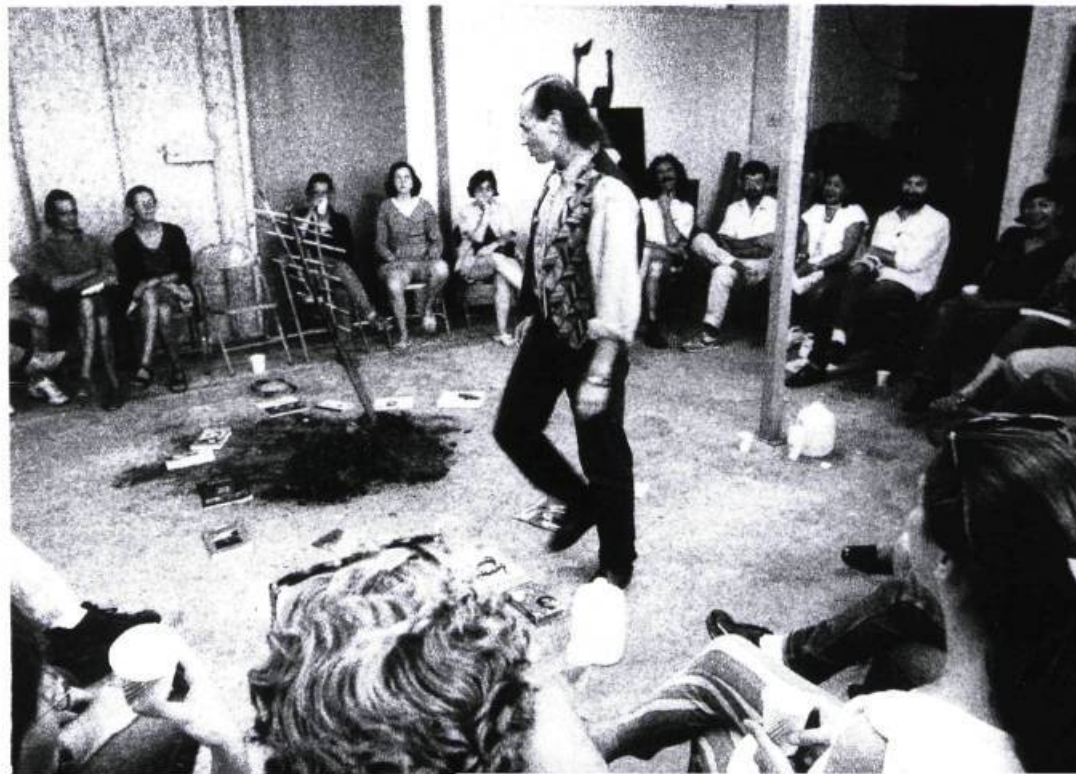
Colloque de l'événement Métissage .

• Les terres culturelles périphériques se développent. Elles accueillent des expositions et projets souvent conçus avant et ailleurs (les activités de la Maison Hamel-Bruneau à Sainte-foy sont exemplaires à cet égard). On commence cependant à lancer des initiatives inédites. Des possibilités infrastructurelles (ex. : parc de sculptures, maisons de la culture ou centres d'artistes sans compétition) se profilent.