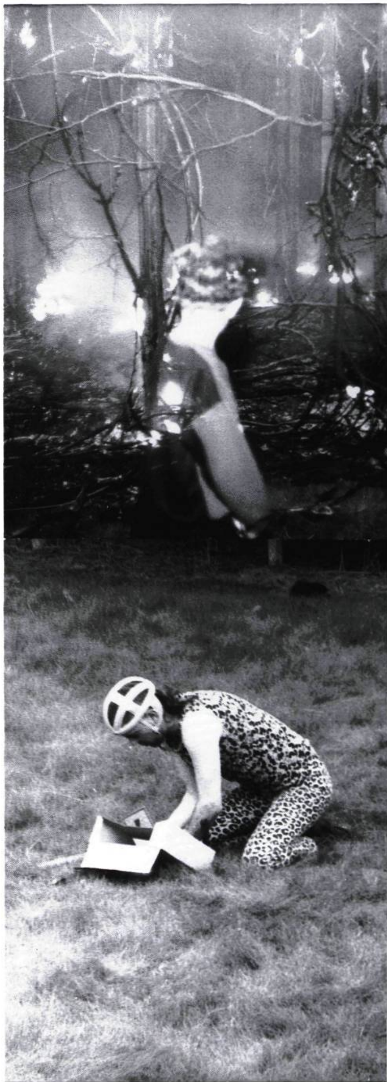
Haut : Espace Frigo, Lyon, France ; bas : Espace Raum F, Zurich, Suisse