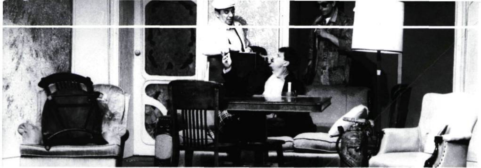
Cohabitation nocturne : Vieux théâtre réaliste, mais dont les ambivalences des personnages m'ont parus les seuls porteurs d'éthique. Gauchement, un théâtre idéologique : peut-on changer ou pas le vécu ? La solidarité a-t-elle cédé le terrain aux plaintes intellectuelles ?

des textes où l'ailleurs et l'autrefois règnent ; constamment on insiste pour définir l'action en fonction d'une région ou d'un quartier familiers ( Les Feluettes à Roberval au Lac St-Jean en 1916 ; Le Syndrome de Cézanne d'un quartier de Montréal vers les Cantons de l'Est ; La Déposition à Jonquière au Saguenay). La mise en scène et le jeu des comédiens ont, au contraire, le fardeau d'être actuel, international, d'atteindre à l'universel. Tout devient affaire d'ingéniosité, non pas de la mise en scène ou de l'artifice technologique mais de la virtuosité des comédiens. Il est très significatif de remarquer comment la critique journalistique d'ici se rabat rapidement sur le jeu de tel ou tel comédien !