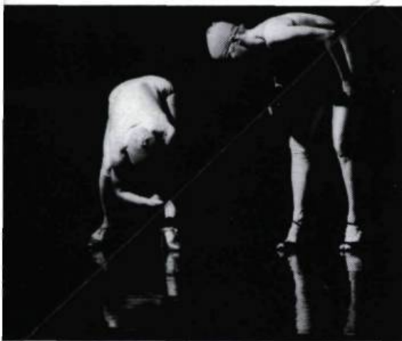
La danse des ortels : Les Finlandais posent ce problème avec une grande virtuosité : l'originalité et la transgression des langues, sans le recours à la technologie, doit-elle tomber dans l'ambiguïté entre la danse actuelle et le numéro de cirque ?

Au théâtre québécois, les compagnies jouent