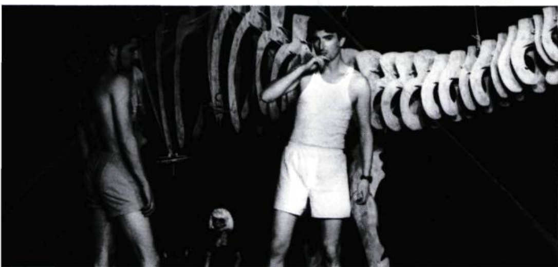
Tears of the Dinosaurs