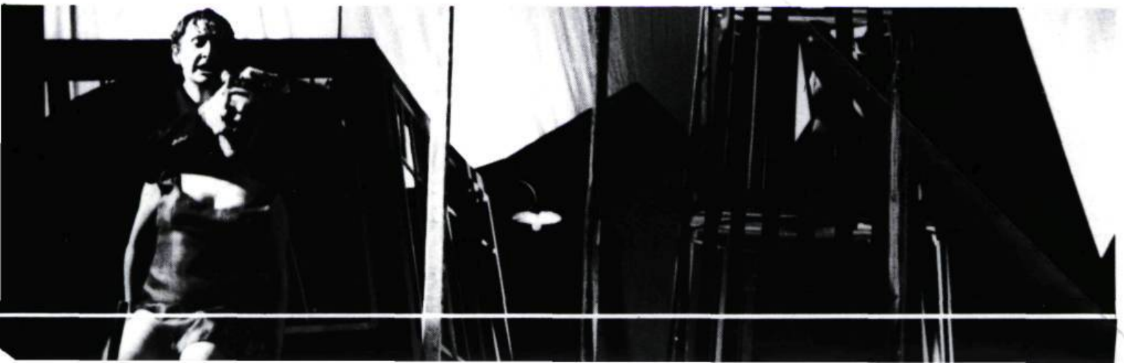
Tableau 3. La dualité idéologique. Diversité vs intensité sur fond de pillage culturel.