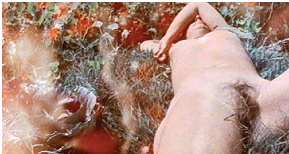
Dyketactics de Barbara Hammer (1974)