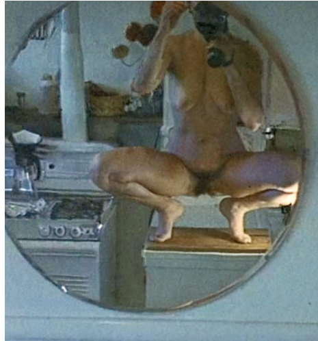
↑ Fireworks de Kenneth Anger (1947)