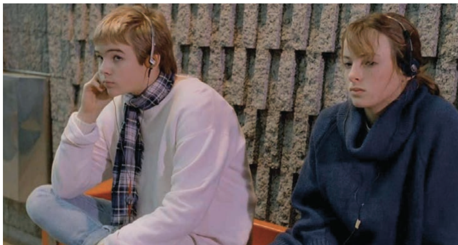
→ Sonatine de Micheline Lanctôt (1984)