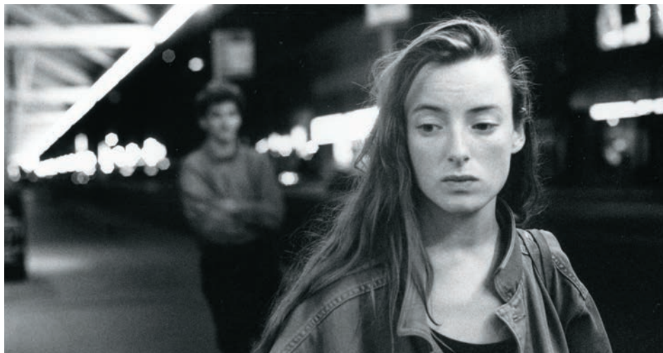
↑ Deux actrices (1993)