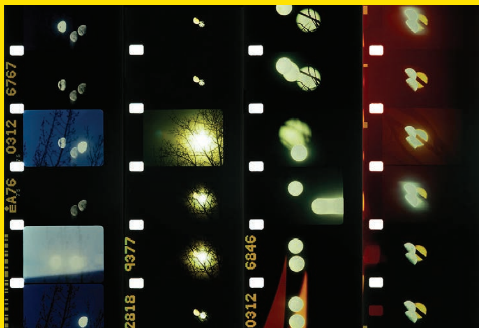
↑ Lunar Almanach de Malena Szlam (2014)