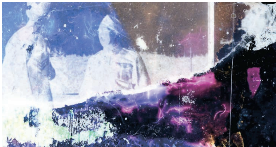
↑ Bulbe tragique de Guillaume Vallée (2016)