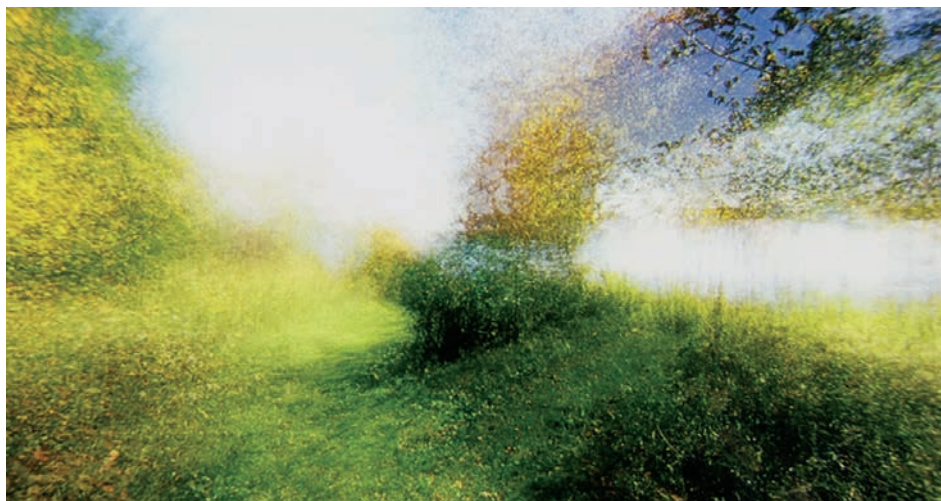
↑ Brouillard #14 de Alexandre Larose (2014)