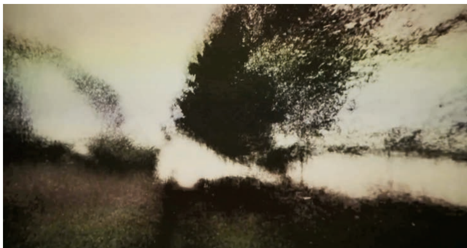
→ Brouillard #19 de Alexandre Larose (2014)