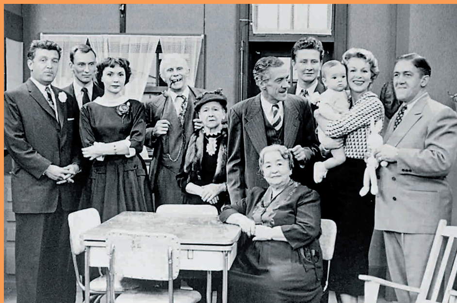
↑ La famille Plouffe de Roger Lemelin (1953-1959)