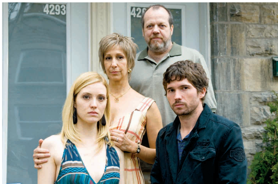
↑ Aveux de Serge Boucher (2009) → Unité 9 de Danielle Trotter (2012-)