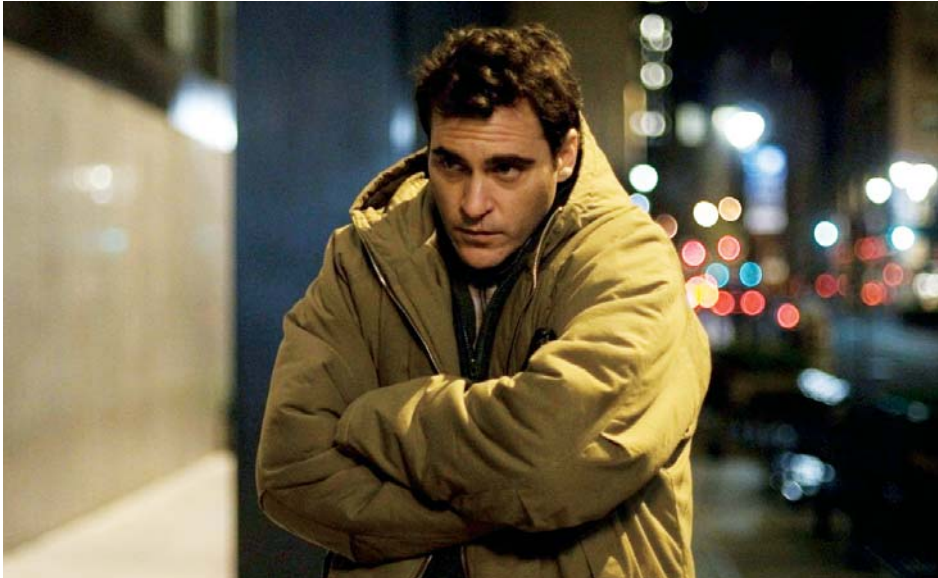
↑ Two Lovers de James Gray (2008)