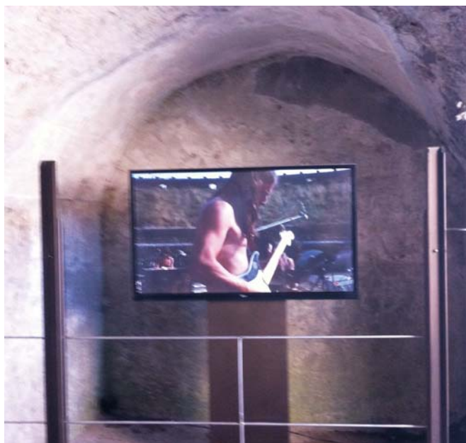
Pink Floyd: Live at Pompeii d'Adrian Maben (1972)

Et à présent, comme les musiciens, je me retire de l'amphithéâtre pour que seul demeure le désir: les seuls mots qui méritent d'exister sont ceux qui sont meilleurs que le silence. 24