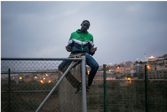
The Great Wall (2016)

mouvements, affichant un équilibre plastique extraordinaire. Brillamment filmé – en Espagne, en Grèce, en Grande Bretagne, en Allemagne – souvent à partir d’un drone, empruntant parfois ses images aux caméras de surveillance qui partout nous ont à l’œil, le film trace un portrait peu rassurant et presque surréaliste de notre planète. Le texte de Kafka, qui date de 1917, semble avoir été écrit pour les besoins du projet et apporte à l’entreprise une dimension poético-philosophique qu’il faut savoir savourer. Cette « muraille » que veut dénoncer O’Sullivan et qu’affrontent tous les migrants du monde, ce sont aussi les polices multiples, les fonctionnaires et les formulaires, les avions et les hélicoptères de surveillance – en un mot, tout ce qui brime nos libertés et nous empêche d’habiter notre planète. (Est-ce bien nécessaire d’ajouter que The Great Wall doit être vu sur grand écran...).