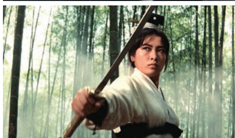
An Actor's Revenge (Kon Ishikawa, 1963)