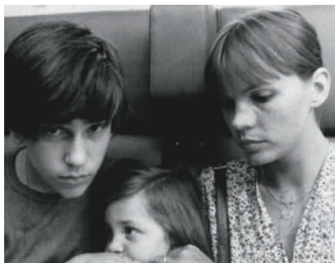
Wanda (Barbara Loden, 1970)