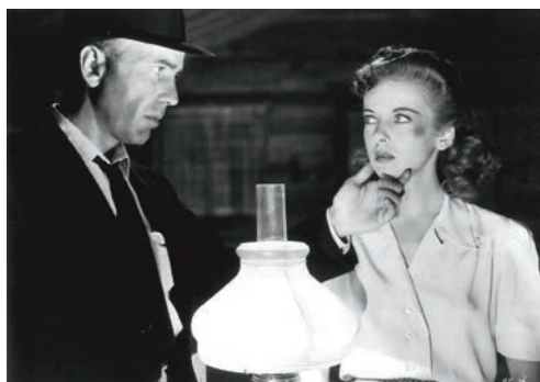
3 Bad Men (John Ford, 1926)