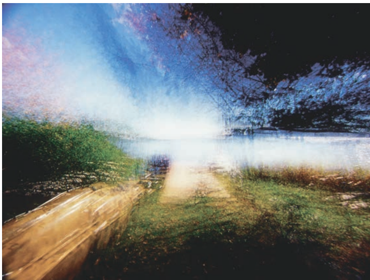
BROUILLARD – PASSAGE # 14

propos recueillis par Charles-André Coderre