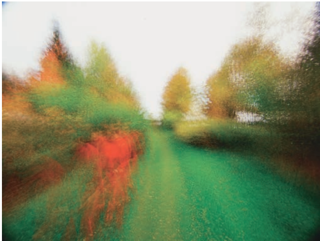
BROUILLARD – PASSAGE #15

Filmiez-vous à la même heure de chaque journée?