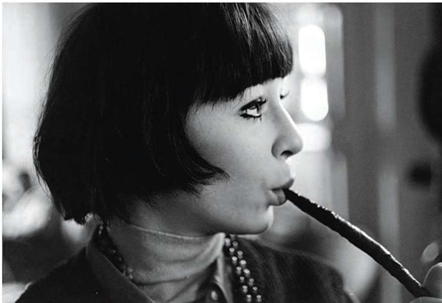
LE CHAT DANS LE SAC