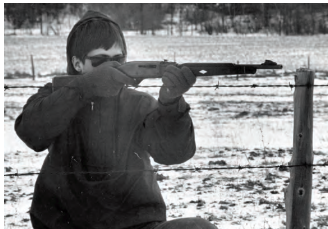
LE CHAT DANS LE SAC