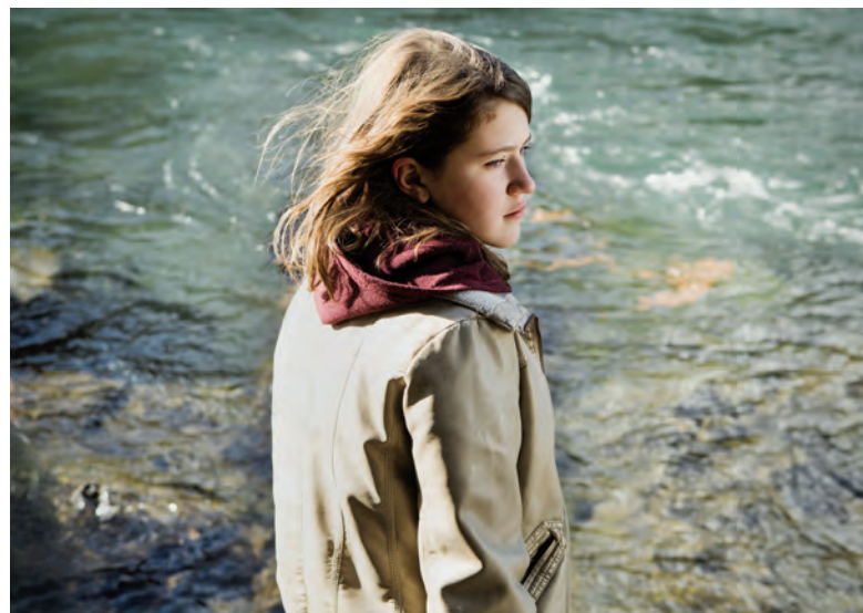
UNE JEUNE FILLE de Catherine Martin

Ne pas perdre la foi dans des jours meilleurs. Il faut souhaiter que ceux qui ont 23 ans en 2014 ressentent, à voir ce film pour la première fois, l'impérieuse nécessité qui détermine Le chat dans le sac . – Catherine Martin