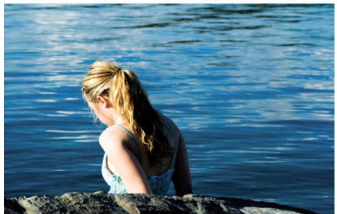
FINISSANT(E)S de Raphaël Ouellet

Une chose que l'on remarque en revoyant des films québécois des années 1960, c'est que la question de la politique est partout présente, alors qu'aujourd'hui, on pourrait presque dire que c'est devenu un