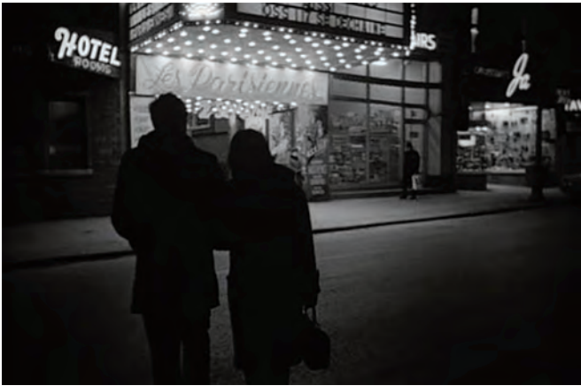
LE CHAT DANS LE SAC

propos recueillis par Alexandre Fontaine Rousseau