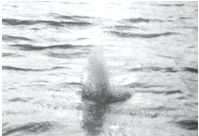
À TOUT PRENDRE

ce n'est pas quinze, et mon amour et ma fascination pour ce film sont allés grandissant au fil des ans. Cinquante ans après sa mise au monde, À tout prendre reste pour moi le film le plus beau, le plus ardent, le plus douloureusement personnel, le plus libre et le plus vivant de toute notre cinématographie. À cette époque où la devise du cinéma québécois semble être « less is more », ce film foisonnant, illuminé par ses audaces formelles, qui entremêle sans complexe ruptures de ton et digressions fantaisistes, en plus de donner à voir des personnages vivant des émotions aussi riches et complexes que celles de la « vraie vie », est une fontaine à laquelle j'irai m'abreuver encore longtemps. — Nathalie Saint-Pierre