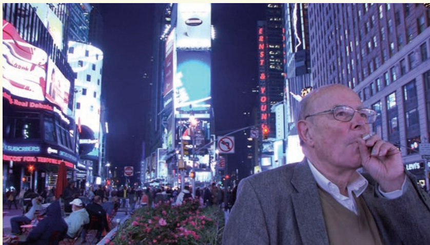
UN VOYAGEUR de Marcel Ophuls

LE DOCUMENTAIRE N'EST JAMAIS AUSSI PERTINENT QUE LORSQUE, LOIN DE FEINDRE LE TON OBJECTIF DE CELUI qui délivre savoir et information, il revendique pleinement une subjectivité de toute façon inévitable. Trois films programmés pendant le Festival de Cannes à quelques jours d'intervalle l'ont rappelé avec éclat, confirmant aussi qu'il y a mille et une façons de dire « je » selon qu'on s'appelle Claude Lanzmann, Marcel Ophuls ou Rithy Panh, trois cinéastes dont les œuvres passées ont en commun l'exploration des pages parmi les plus douloureuses de l'histoire du vingtième siècle.