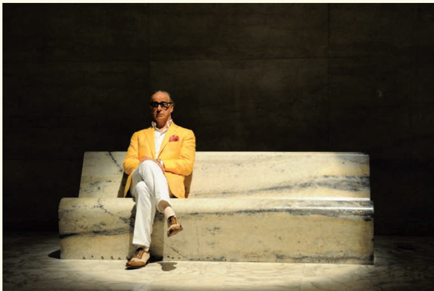
LA GRANDE BELLEZZA de Paolo Sorrentino