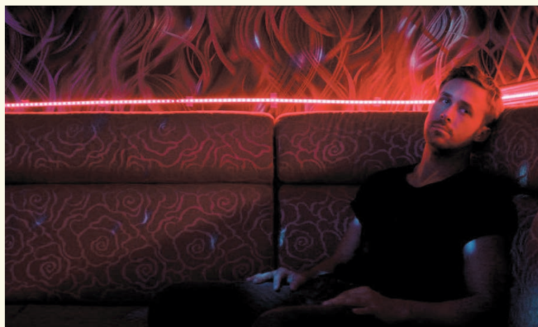
ONLY GOD FORGIVES de Nicolas Winding Refn