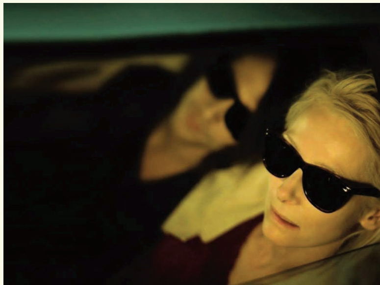
ONLYLOVERS LEFT ALIVE de Jim Jarmusch

d'autres...), le cinéma (Fellini, et plus généralement tous les maîtres d'un âge d'or révolu du cinéma italien), la musique (avec ses raccourcis fulgurants entre musique classique et techno post quelque chose), l'architecture (il y a ce gardien qui détient des clés des palais romains, désormais vides, vastes enfilades de pièces dans lesquelles s'entassent les chefs-d'œuvre, terrible et magnifique