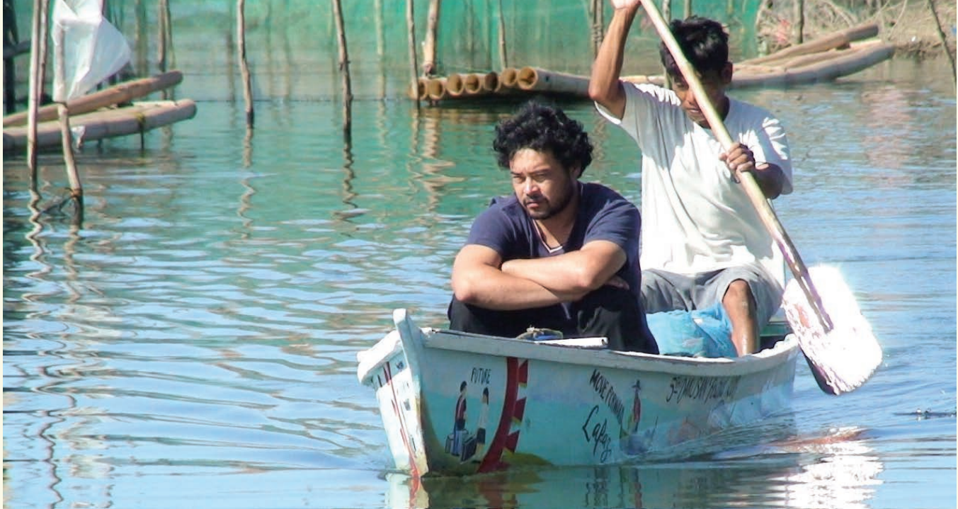
NORTE, LA FIN DE L'HISTOIRE de Lav Diaz

provoquer un épuisement quasiment physique. Un grand film ne saurait être qu'adulé ou détesté. Un grand film ne raconte pas une histoire, il les raconte toutes, il n'en raconte aucune, il crée une transe. C'est le cas de La grande bellezza (un titre osé pour dire le cinéma, sa beauté noire parfois maléfique et non pas celle, déchue, de la Rome de Romulus et Remus), de Jarmusch et de ses vampires, créateurs métaphoriques et dépositaires de toute la culture de ces 500 dernières années.