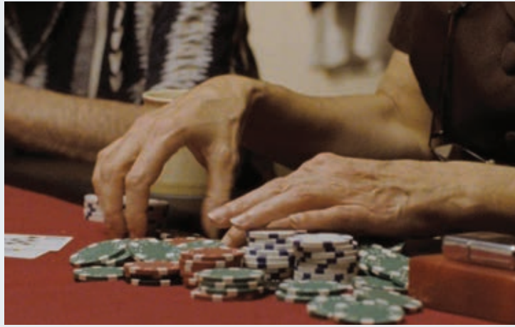
LA MISE À L'AVEUGLE

propos recueillis par Marie-Claude Loiseleur