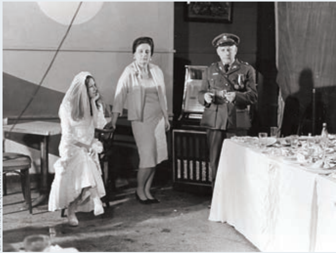
BAR SALON d'André Forcier