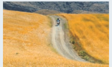
LA VOIE LACTÉE de Luis Buñuel, AMARCORD de Federico Fellini, THE MAN FROM LARAMIE d'Anthony Mann, LE VENT NOUS EMPORTERA d'Abbas Kiarostami