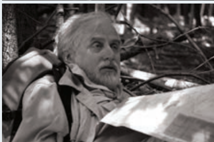
NUAGES SUR LA VILLE (2009)

est assez exceptionnelle. Comment l'avez-vous conçue?