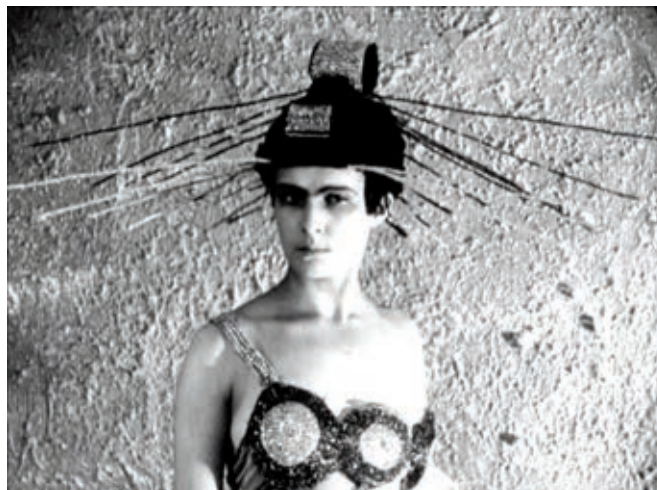
AELITA (1924), d'Yakov Protazanov

L'UTOPIE EST UNE PROJECTION VERS UN AILLEURS, UN AUTRE TEMPS (UCHRONIE), UN AUTRE MODE D'EXISTENCE (révolution). Elle fut le fruit d'un rapport textuel (un livre de Thomas More) avant de copuler avec les autres arts et de se faire tout un cinéma de spéculations imaginaires. Puis elle a avorté de sa charge subjective merveilleuse en passant du rêve à des réalités cruelles (goulag, révolution culturelle, Pol Pot, etc.). Son retour, sur fond de désenchantement politique, ne peut faire l'économie d'une métamorphose radicale : nous l'appellerons Luttopie .