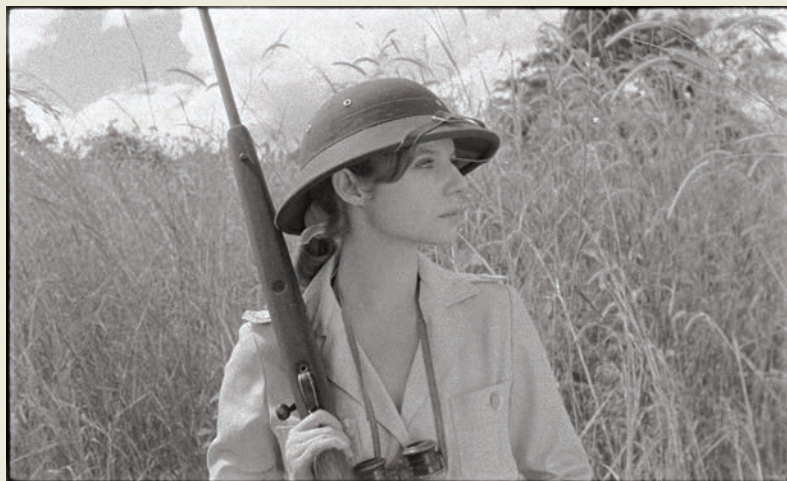
TABU de Miguel Gomes

Lorsqu'un cinéaste vient s'adresser au public en disant : « Vous savez, je ne suis pas très intelligent, je ne comprends pas vite les choses... », on se dit qu'il doit y avoir un peu de vrai dans cette fausse modestie. Pour ce qui est de Miguel Gomes, qui a fait cette déclaration avant la présentation de Tabu au dernier Festival du nouveau cinéma, on se rend compte que cette naïveté feinte est davantage une manière de s'autoriser un regard nostalgique sur l'histoire coloniale du Portugal sans avoir l'air d'y toucher. Elle permet d'enfouir toute responsabilité collective sous une forme qui se veut comme une ode innocente et simple à un temps révolu. « Je crois bien, a-t-il rajouté, que mon film parle de la mémoire et de toutes ces choses qui disparaissent. » L'époque coloniale serait-elle devenue à ce point une abstraction, 50 ans après le début des indépendances, qu'on puisse ainsi exalter la mémoire de ce « paradis perdu » sur un mode badin ?