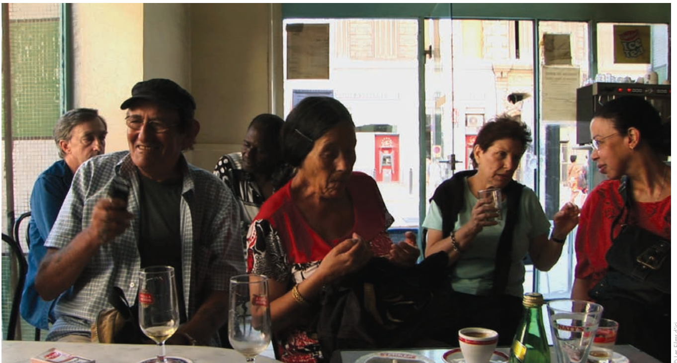
La république (de la série «La république Marseille»)