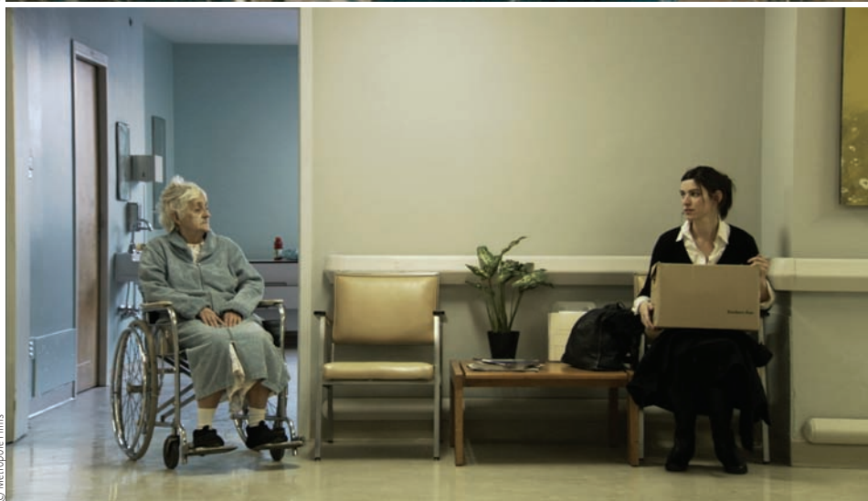
Jo pour Jonathan (2011) de Maxime Giroux et Les signes vitaux (2009) de Sophie Deraspe

ritoire. Ils montrent ce qu'ils connaissent : Ouellet filme Dégelis, son village; Verreault et Bernadet arpentent la banlieue de leur enfance; Galiero, Giroux et Lafleur filment probablement les banlieues pavillonnaires qu'ils ont habitées, etc.